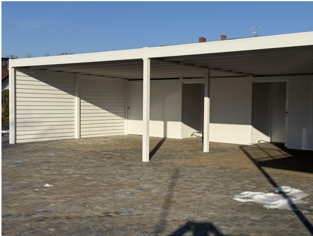
Carports mit Abstellraum