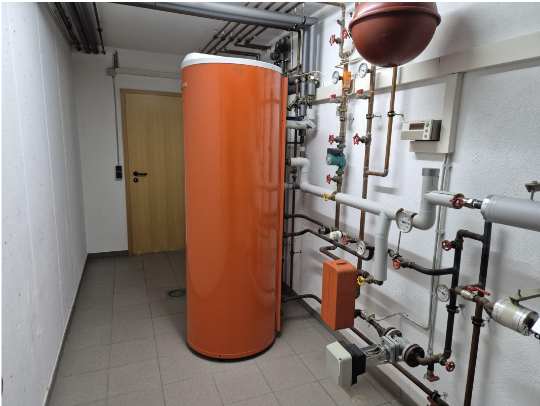
18_Fernheizung im UG