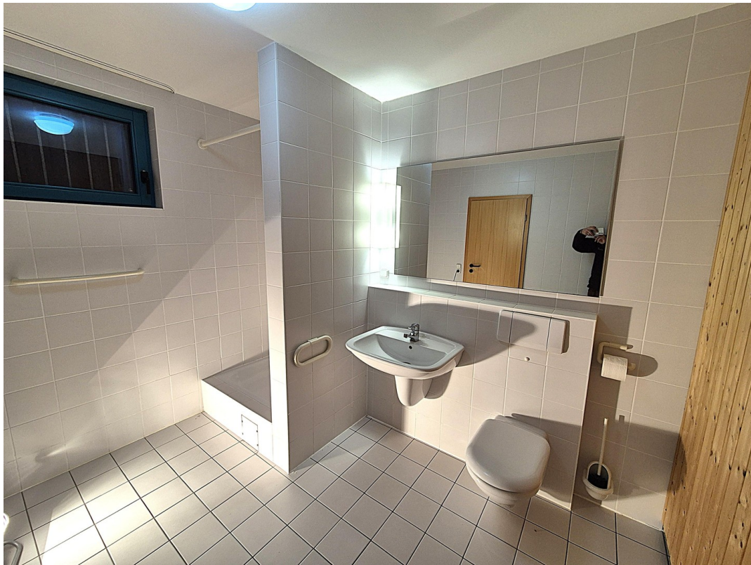
15_Bad im UG