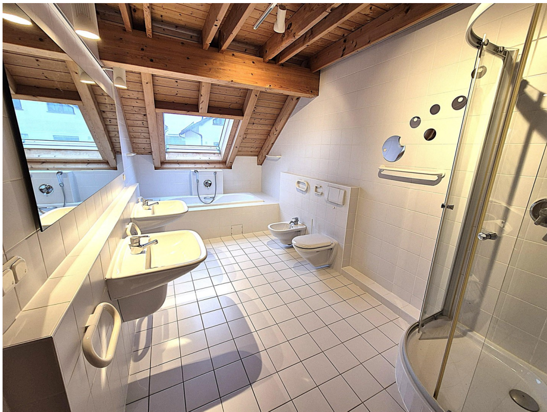
10_Bad im OG