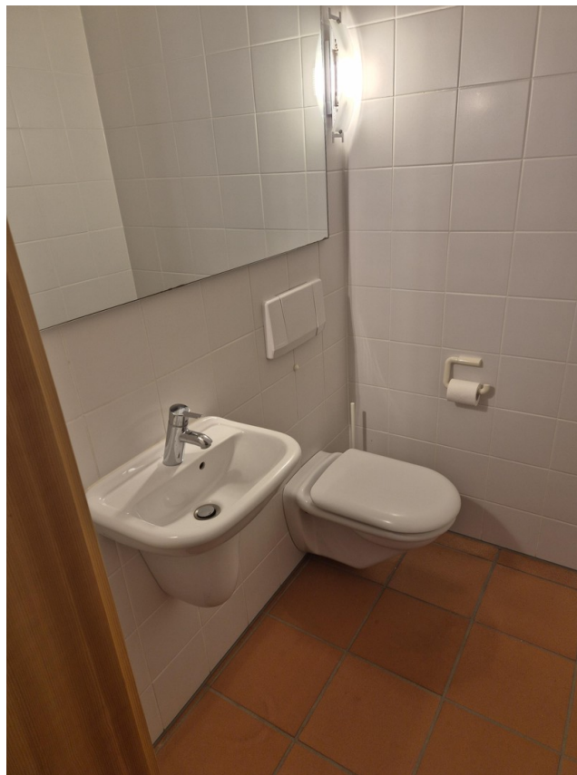
6_Gäste WC im EG