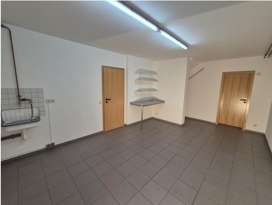
17_Hauswirtschaftsraum im UG