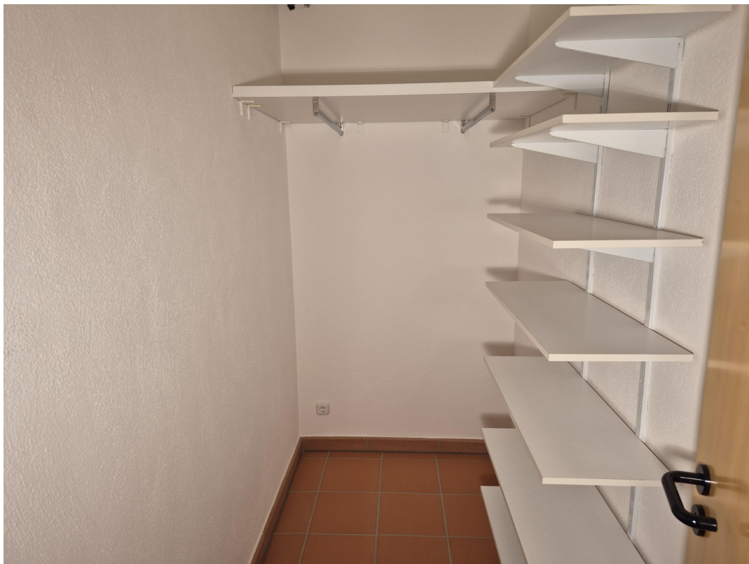
14_Gardrobe im UG