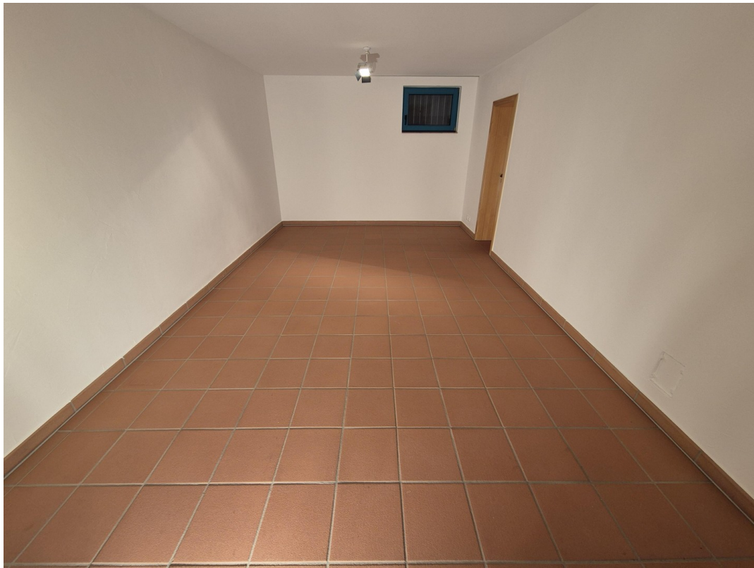
13_Hobbyraum im UG