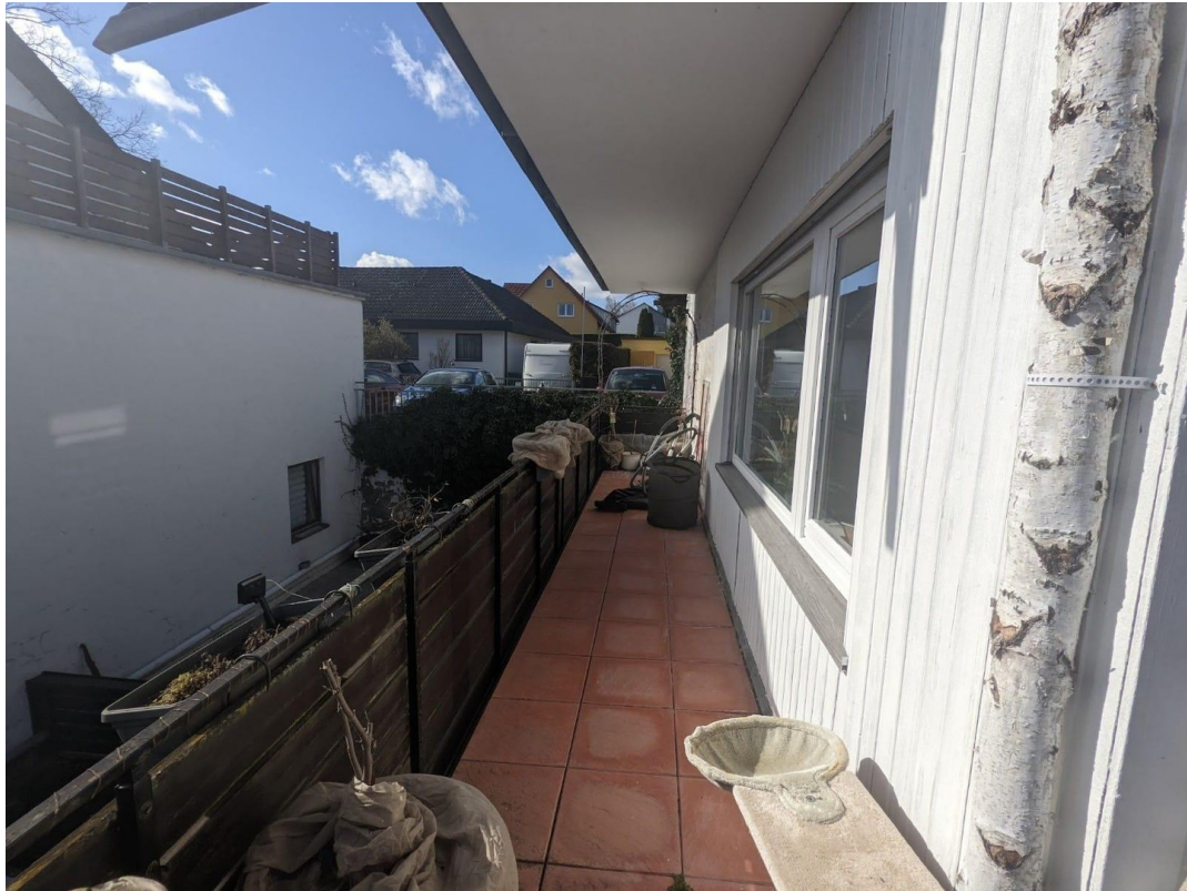
Balkon mit Ausblick