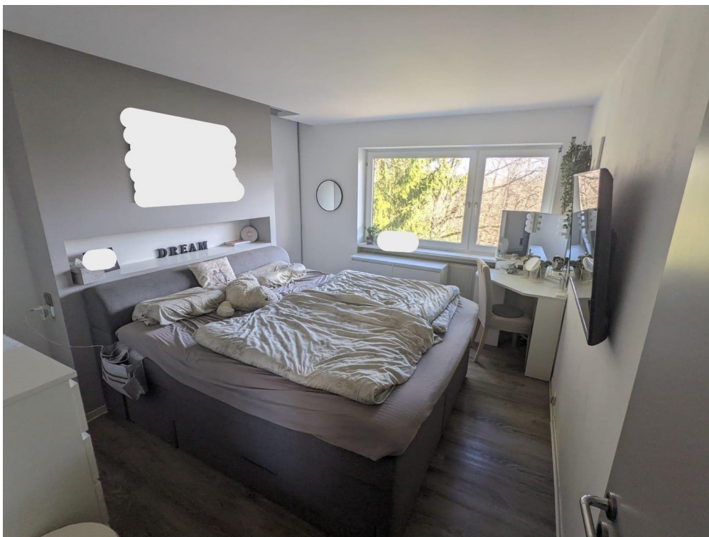
Schlafzimmer mit beg. Kleiders