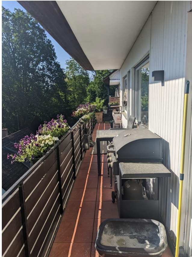
Balkon mit Ausblick