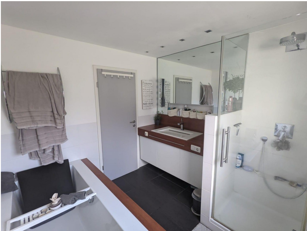
Bad mit Dusche und Wanne