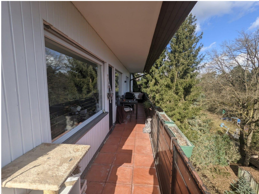
Balkon mit Ausblick