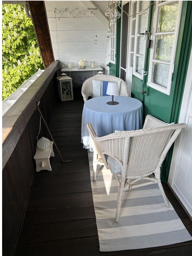
Balkon zweiter Stock