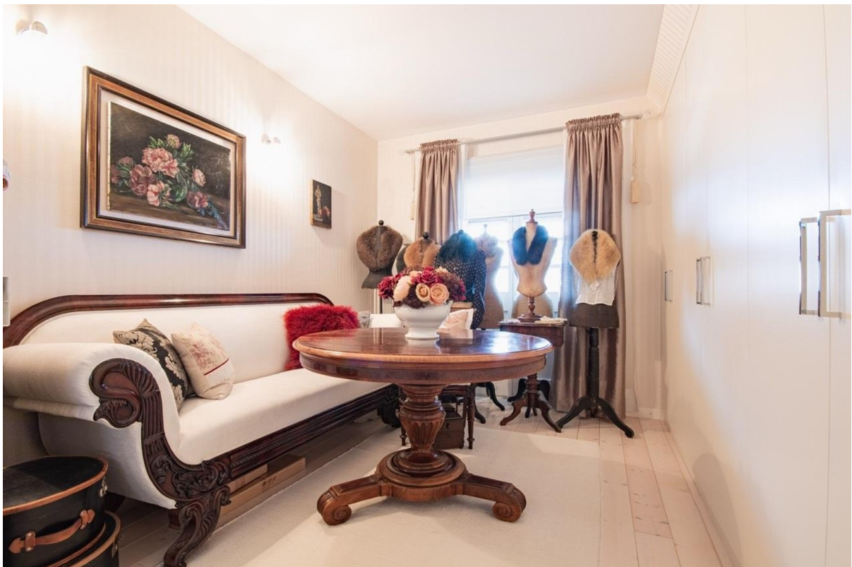
Ankleidezimmer zweiter Stock