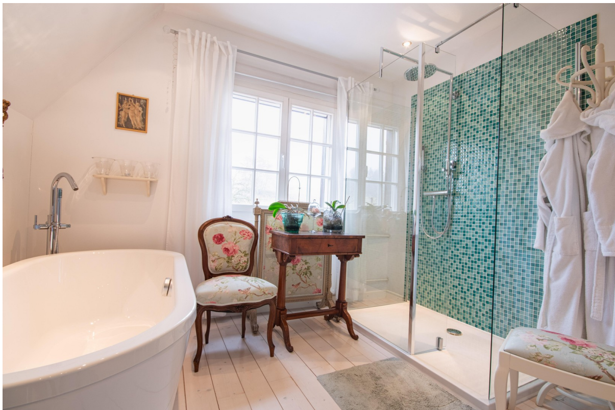
Bad zweiter Stock