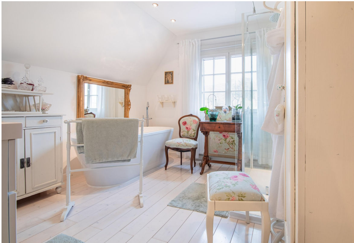
Bad zweiter Stock