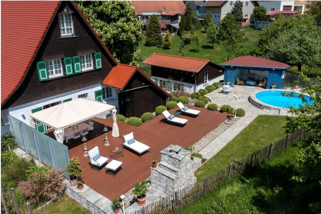
Luftbild mit Terrasse