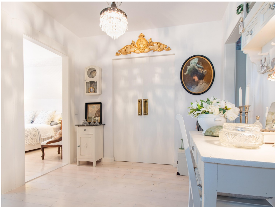
Flur zweiter Stock