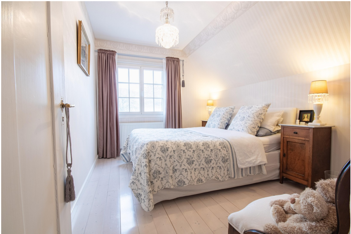
Schlafzimmer zweiter Stock