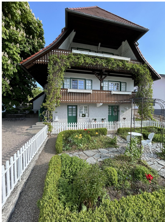
Vorderansicht mit Eingang