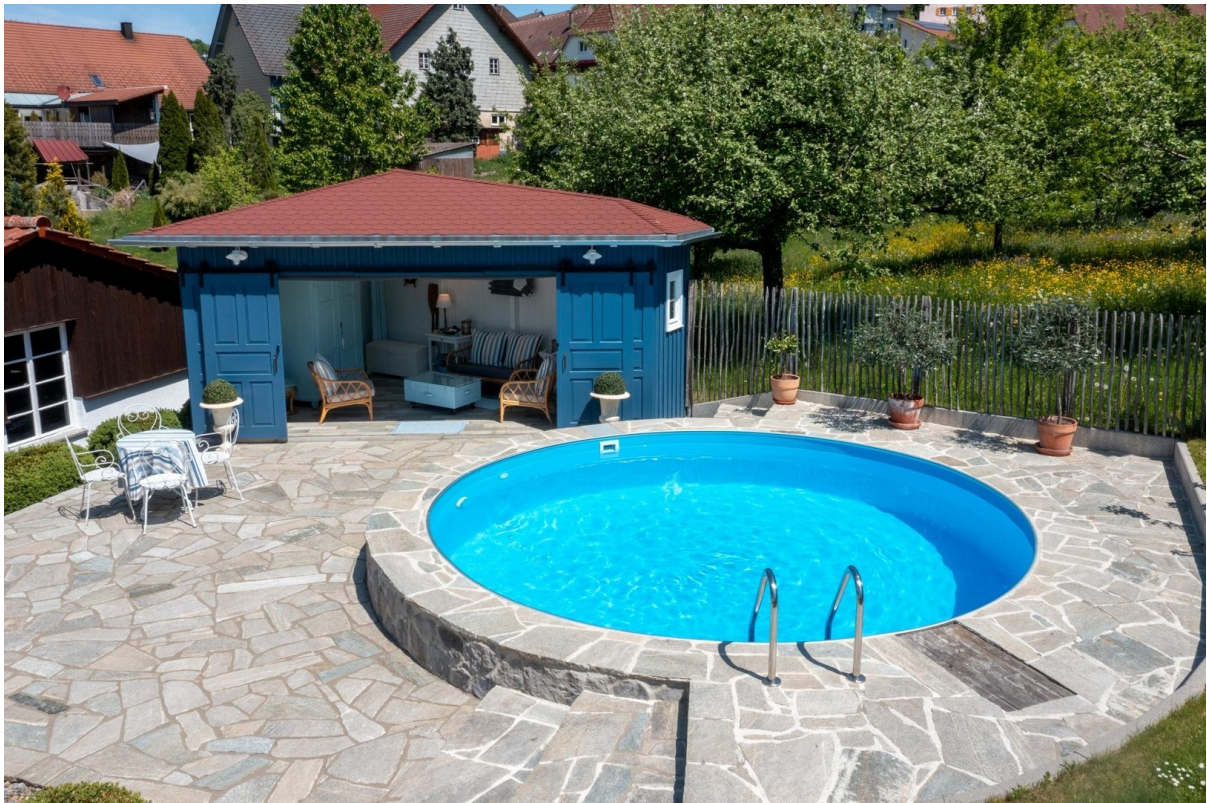
Pool mit Poolhaus