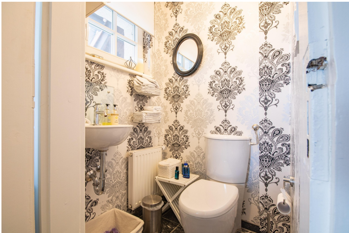
Toilette erster Stock