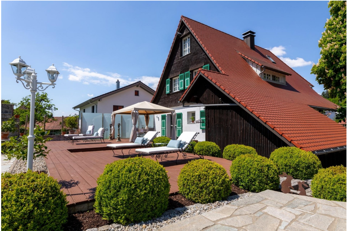
Rückansicht mit Terrasse