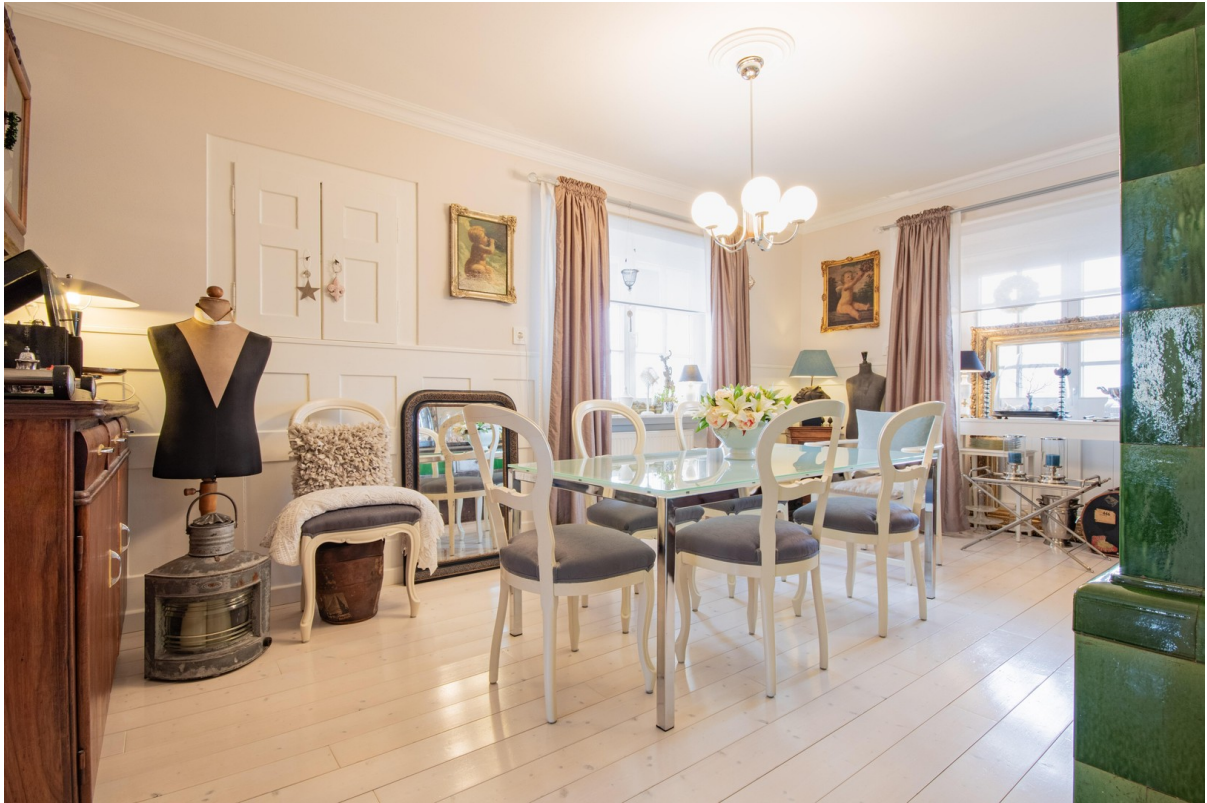
Esszimmer mit anderen Stühlen