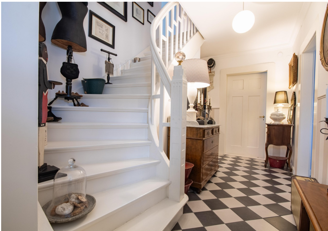
Flur erster Stock mit Treppe