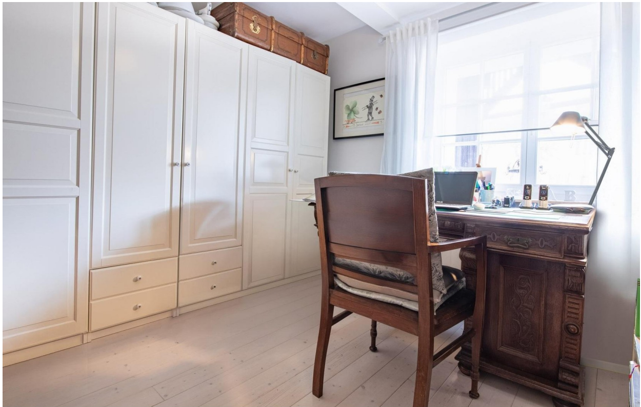
Büro erster Stock