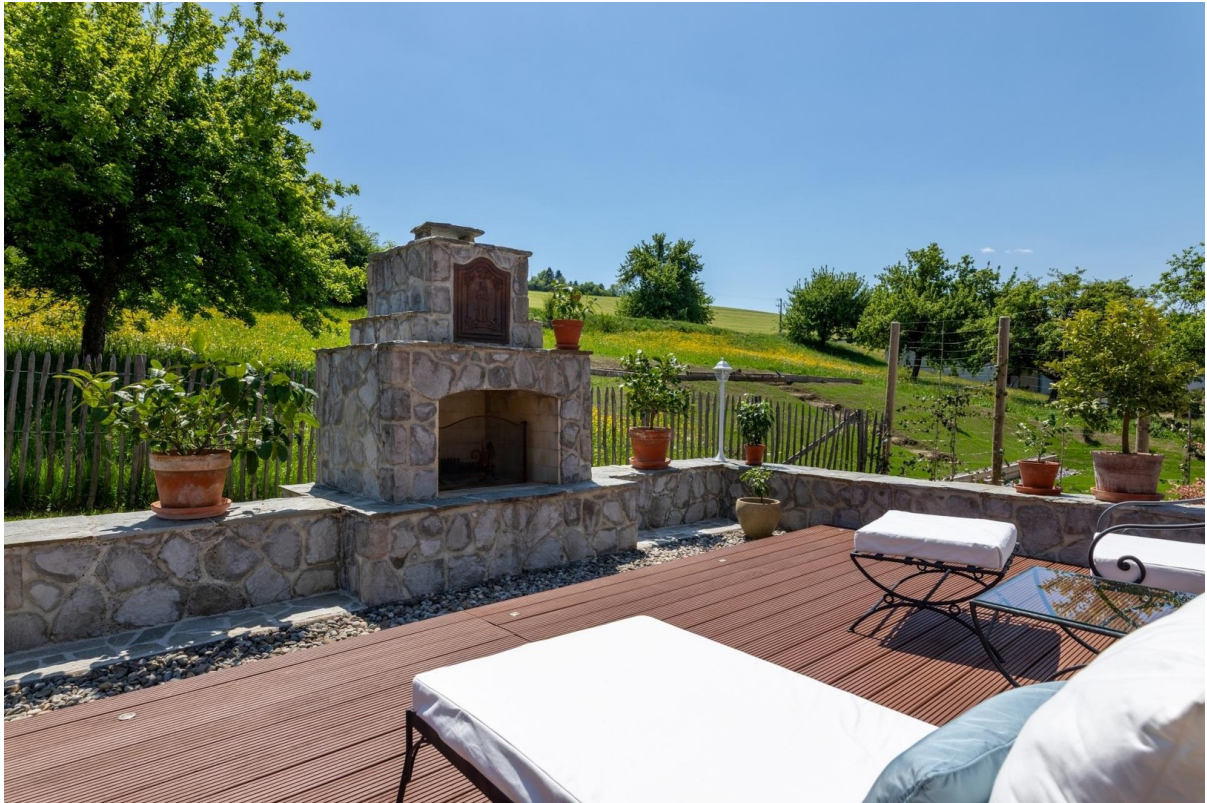
Offener Kamin Terrasse