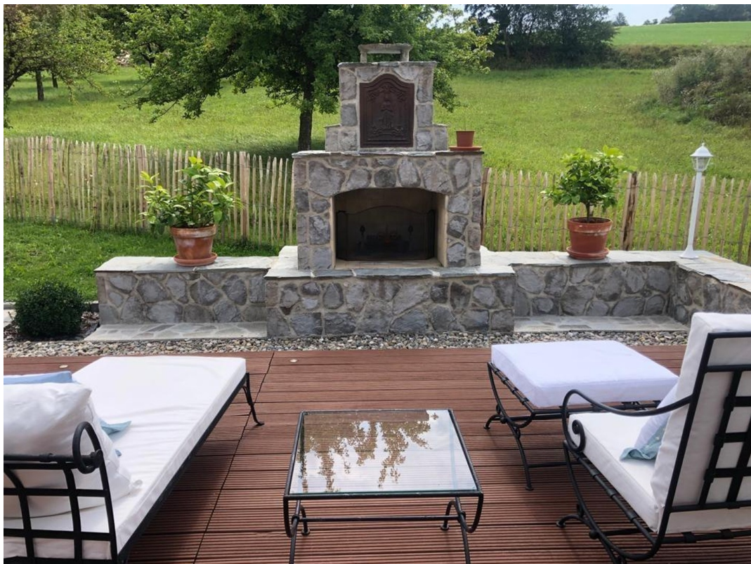
Blick auf den offenen Kamin