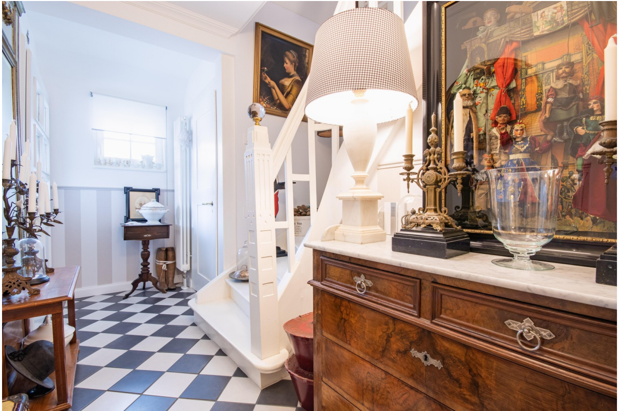
Flur erster Stock