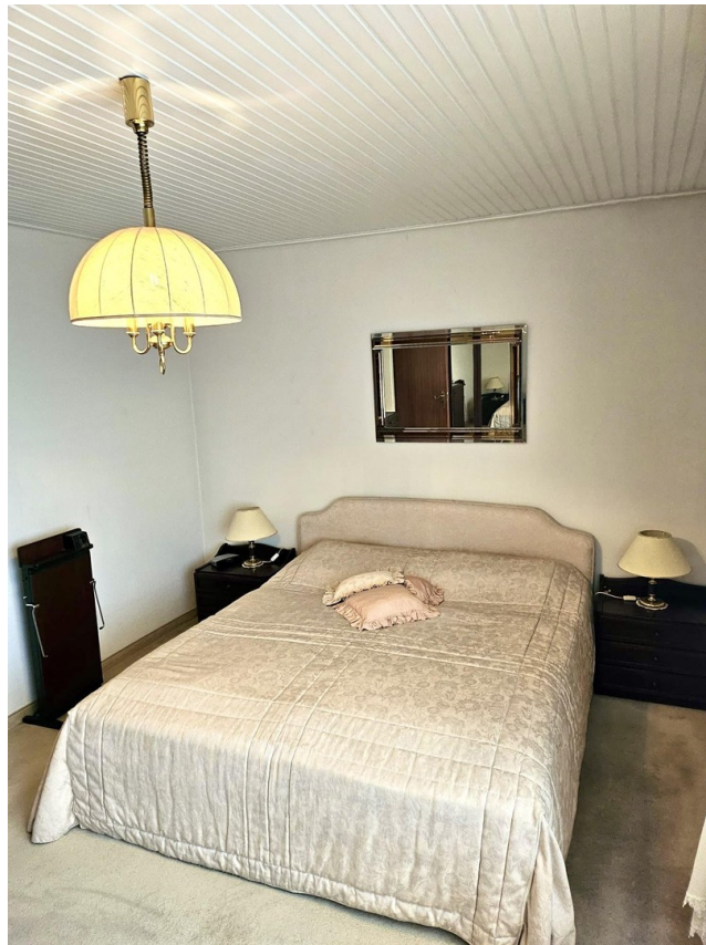
Zimmer 2 1.OG