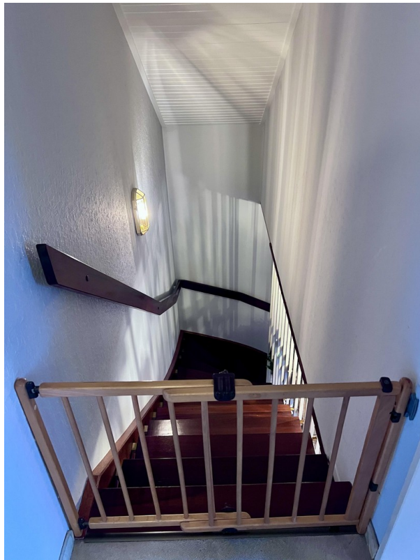
Mahagoni Treppe zum 1.OG