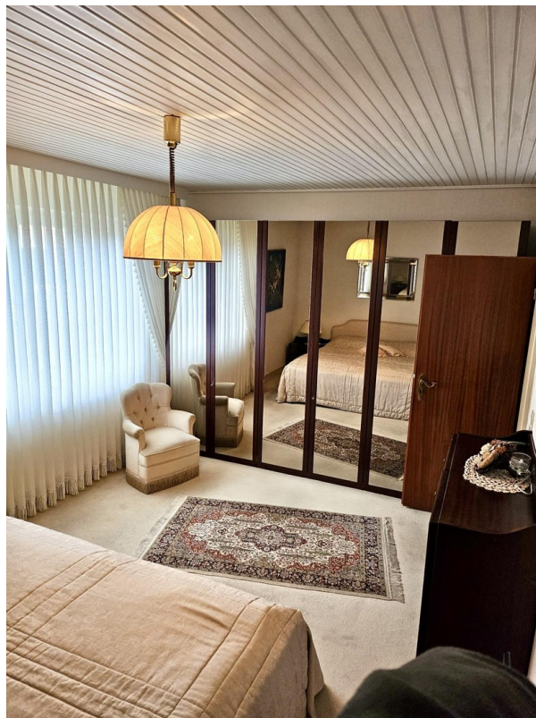
Zimmer 2 1. OG