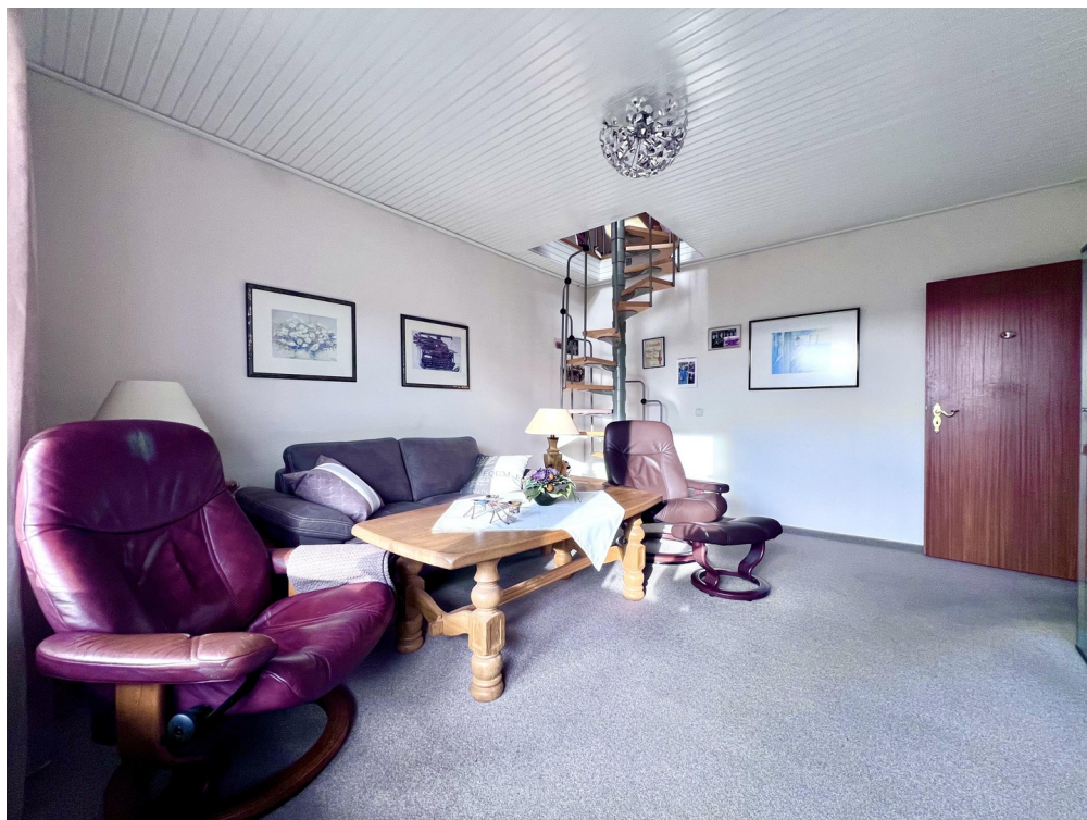
Zimmer 4 1.OG