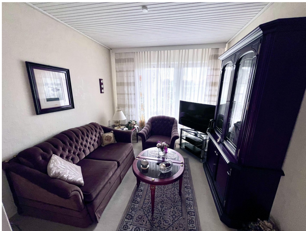
Zimmer 3 1.OG