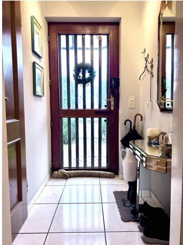
Haustür mit kleinem Flur