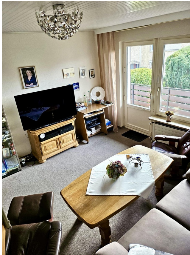
Zimmer 4 1.OG