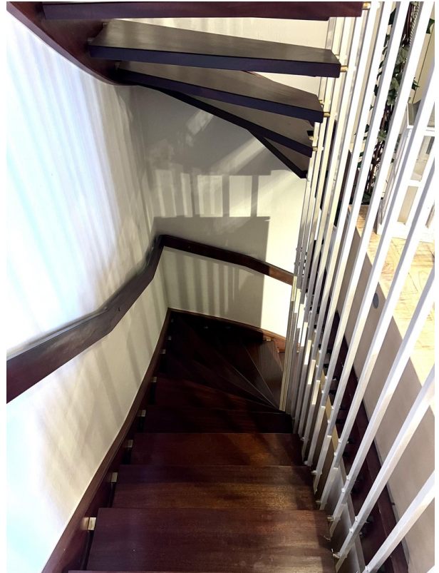
Mahagoni Treppe Untergeschoss