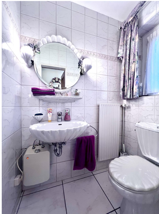
Gäste WC EG