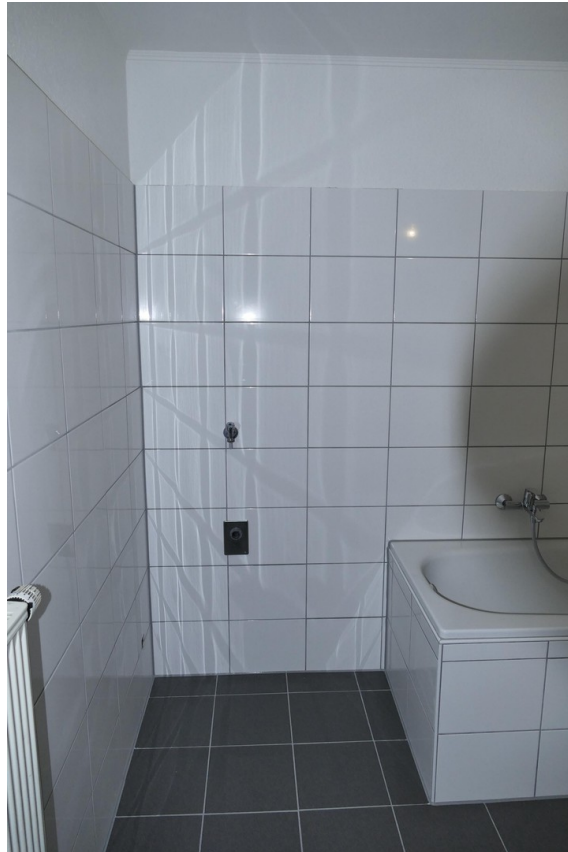
Bad WaMa Stellplatz