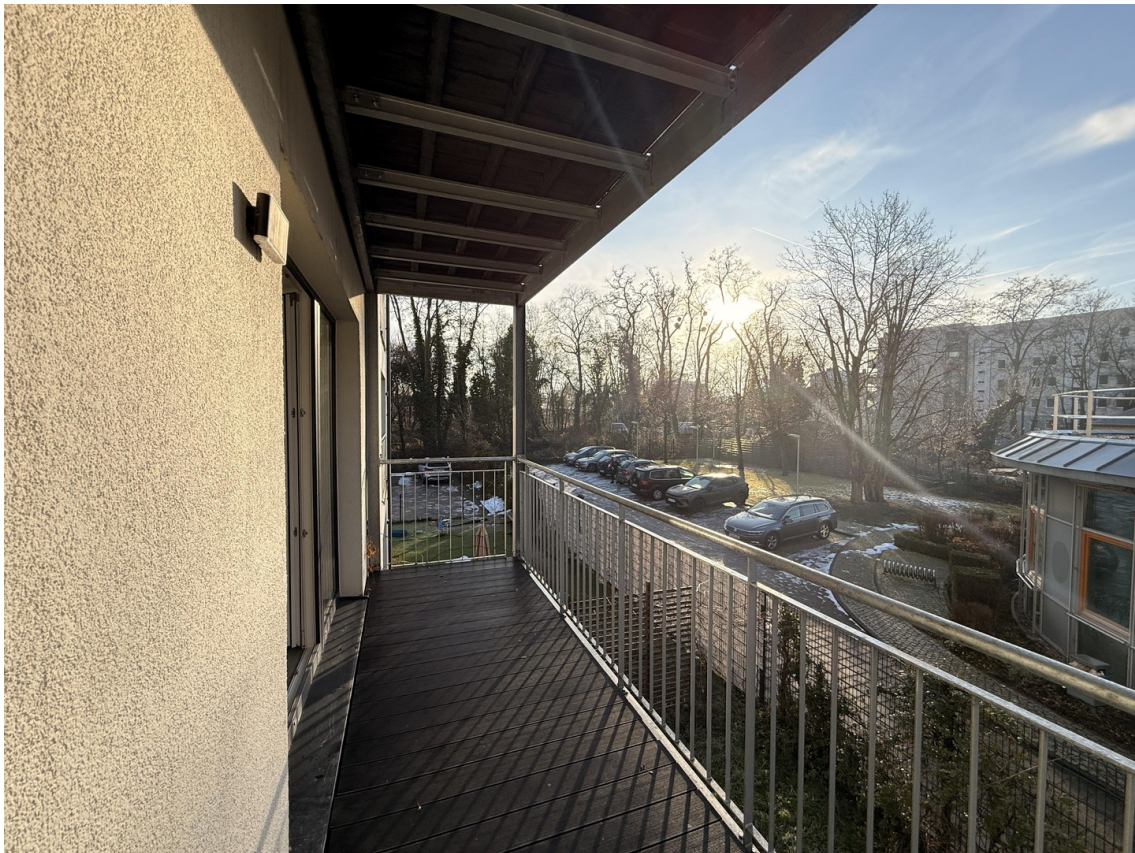
Balkon (vor Einzug)