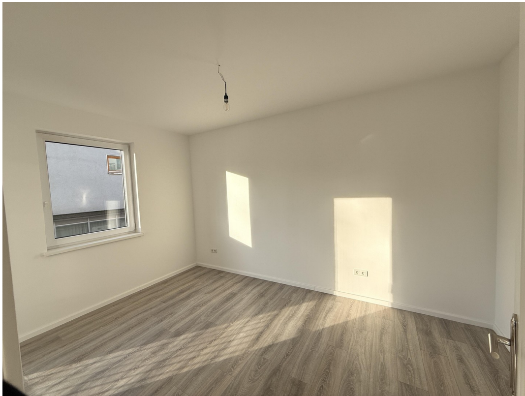
Schlafzimmer (vor Einzug)