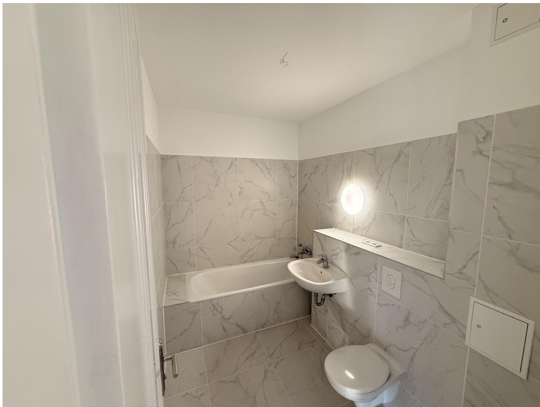
Bad (vor Einzug)