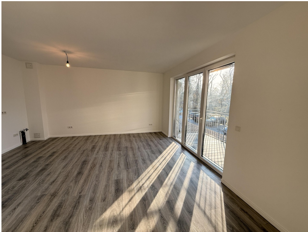
Wohnküche (vor Einzug)