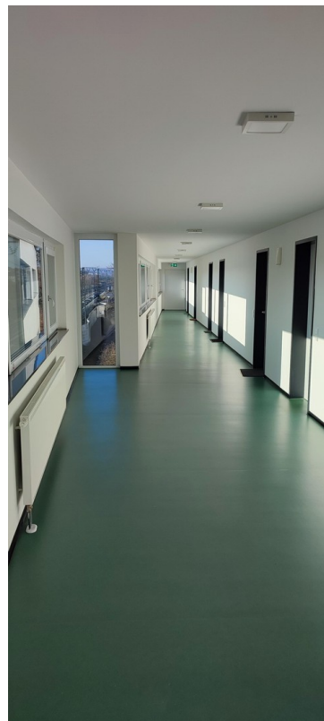
Flur 4. Stock