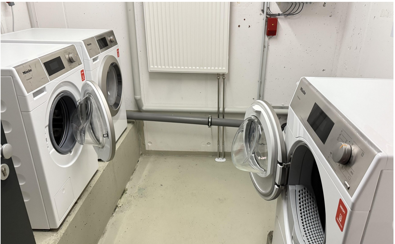
Waschmaschinen- und Trocknerraum