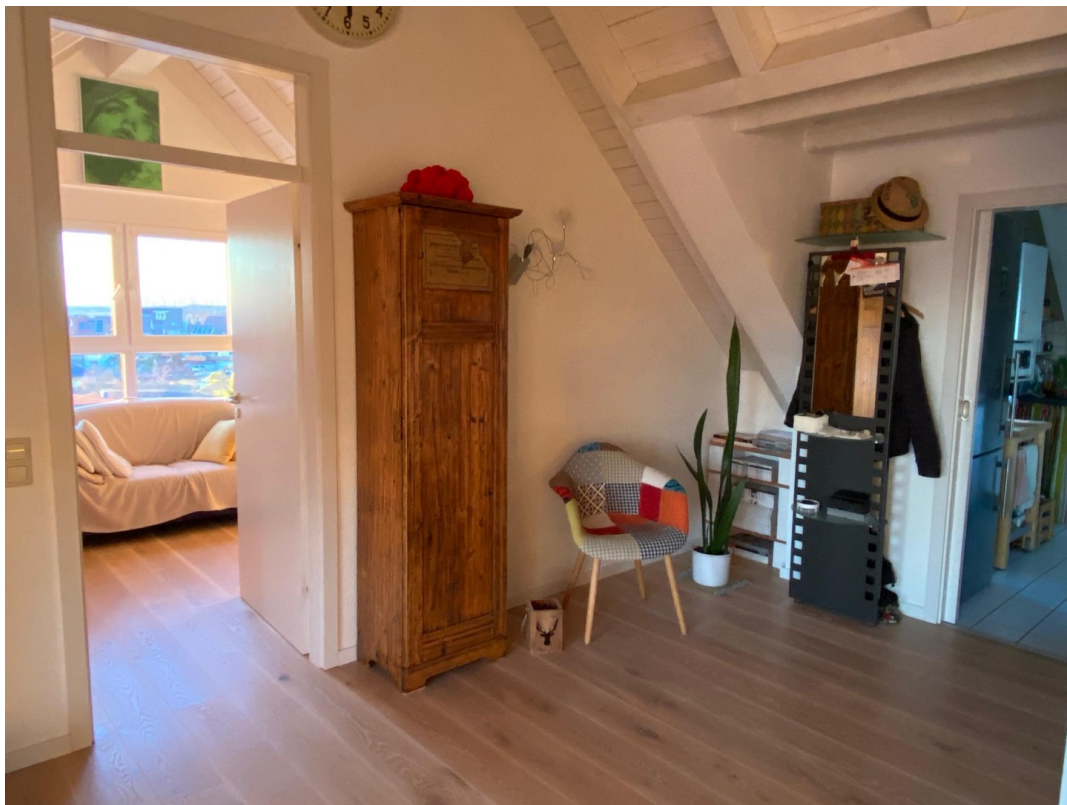
Blick ins Büro/Kinderzimmer