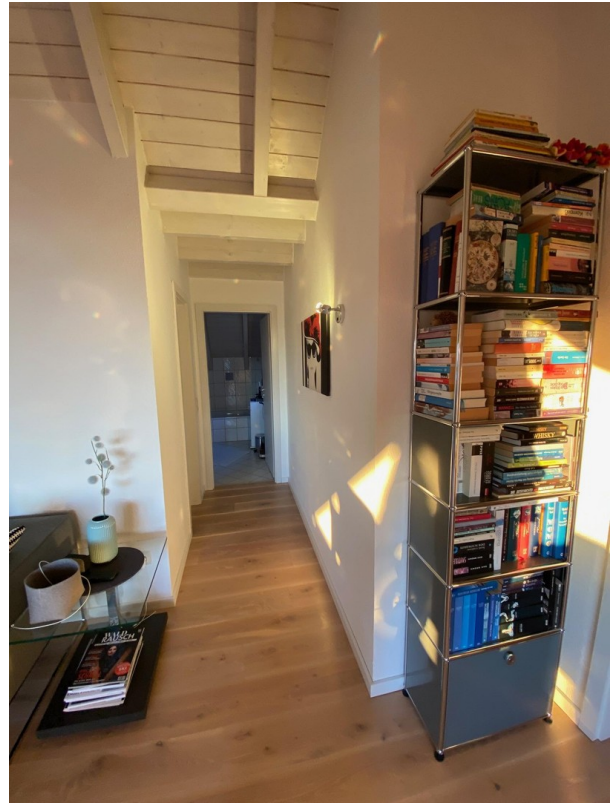
Flur zum Badezimmer