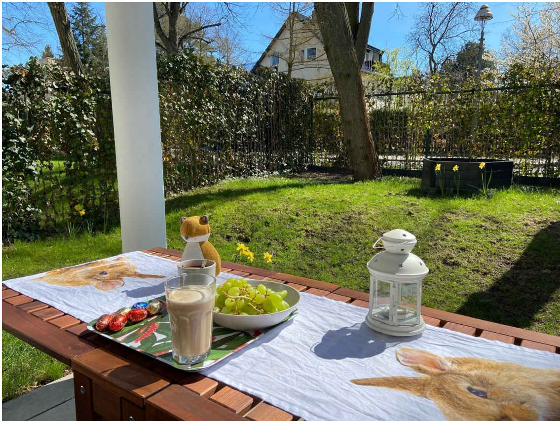
Genießen auf der großen Terras