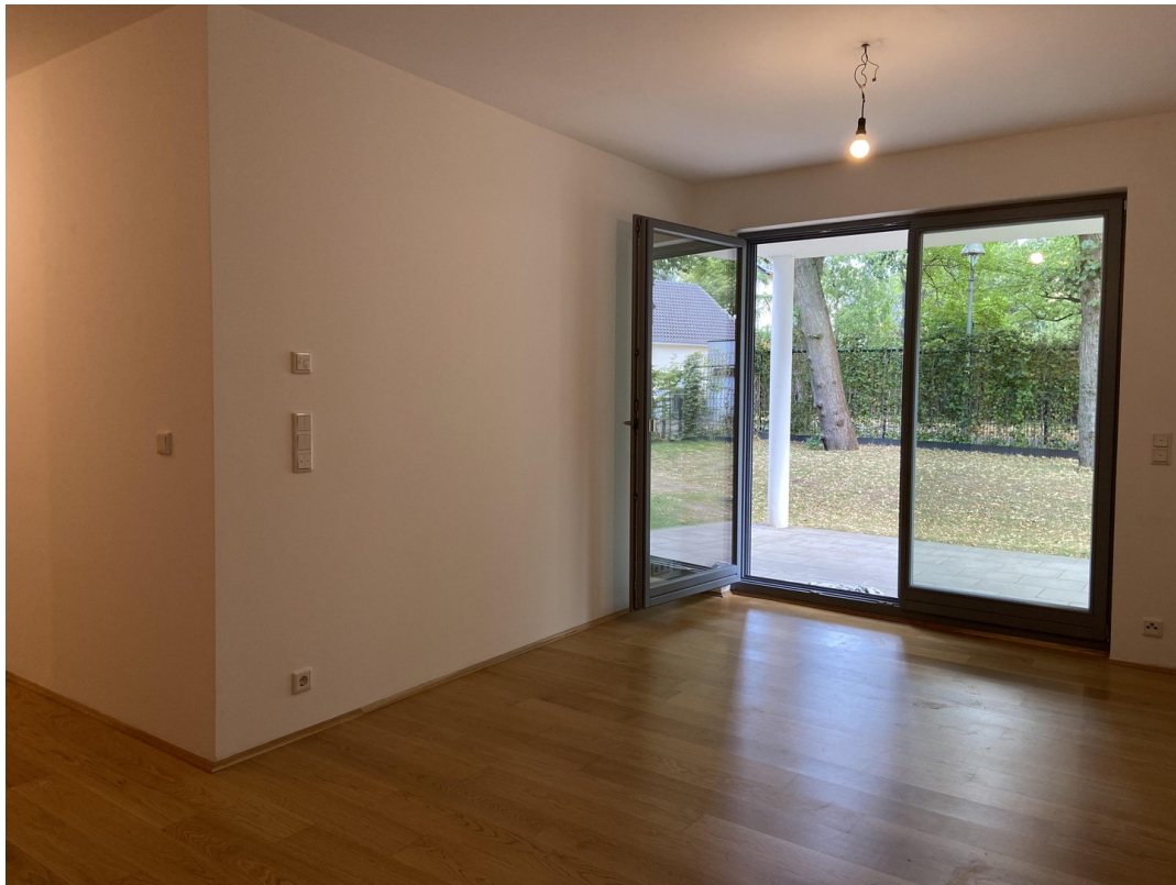
Garten wird zum Wohnzimmer