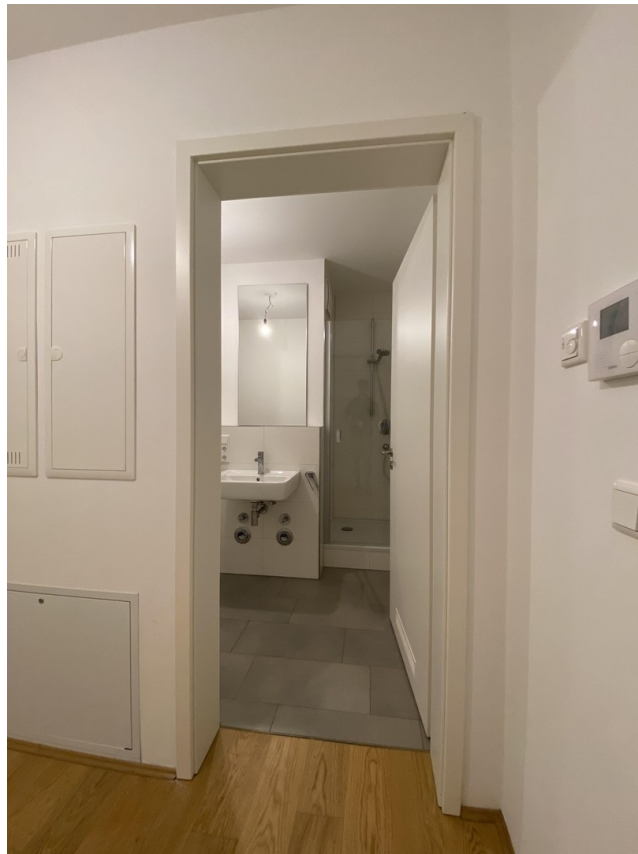
Eingang und Technik