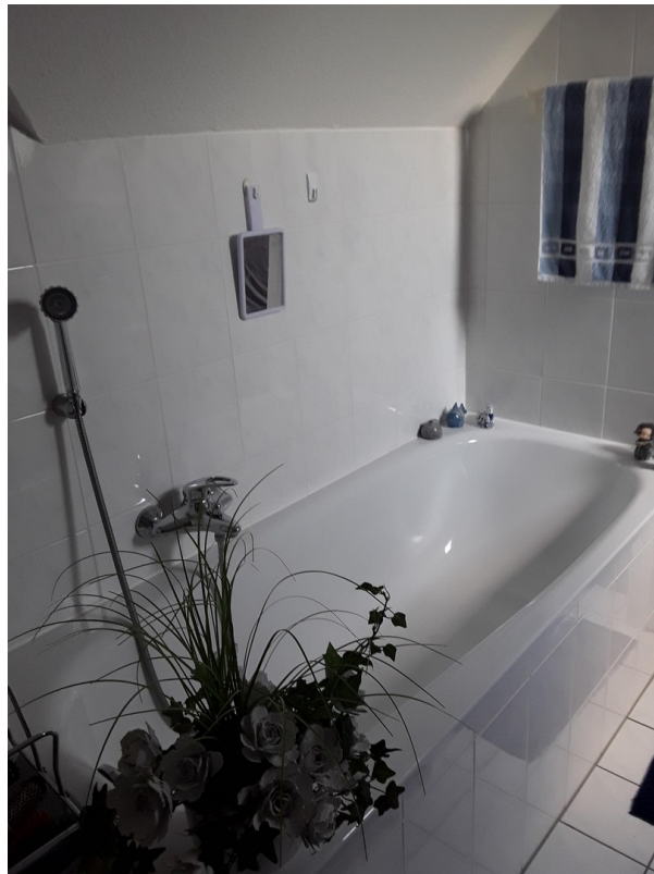
Badewanne im Badezimmer