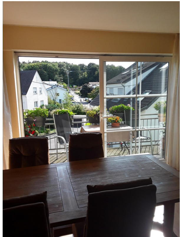
Ausblick vom Wohnzimmer