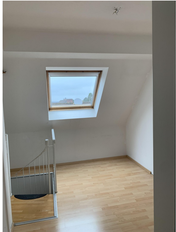
Empore ( 1/2 Zimmer)