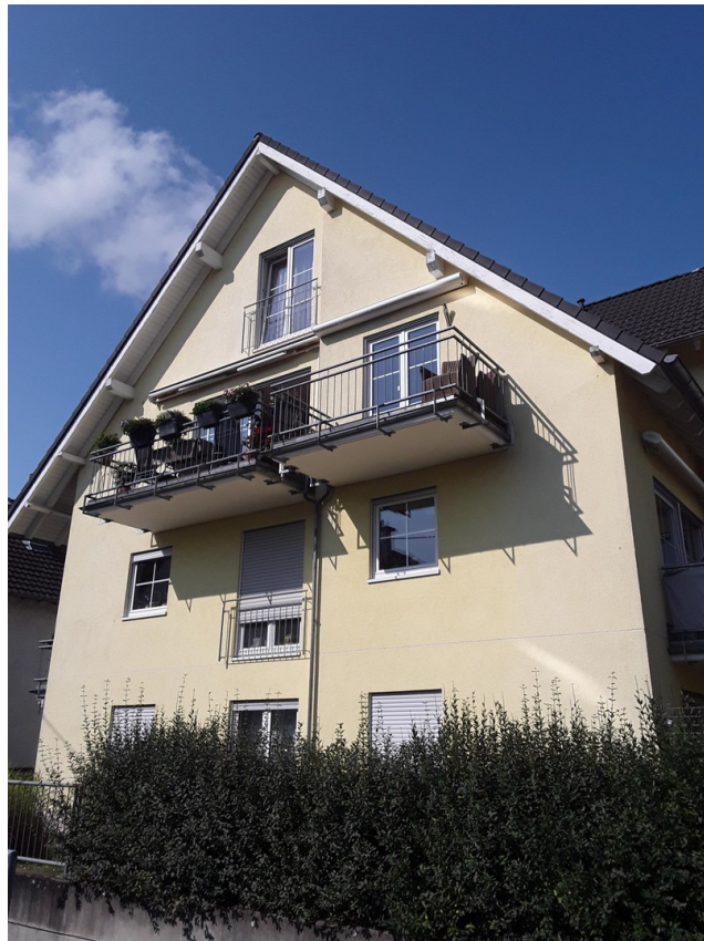
Süd-Seite mit Sonnenbalkon