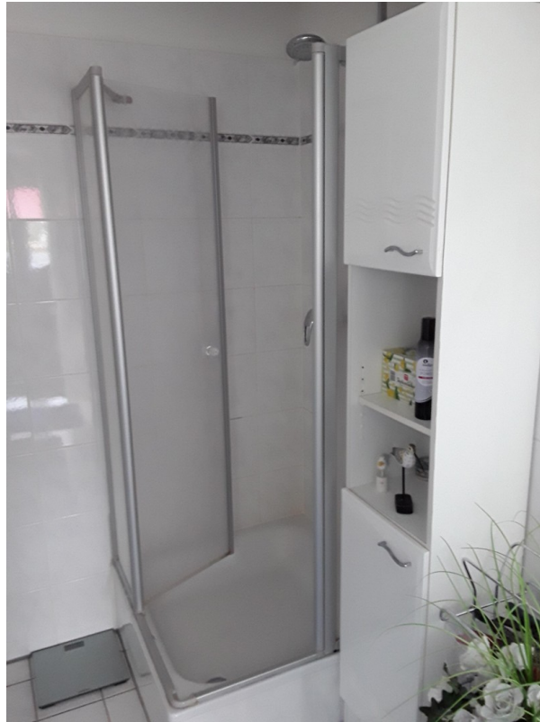
Dusche im Badezimmer