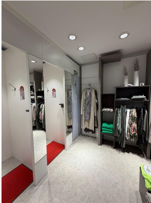
Zugang zum OG hinten links