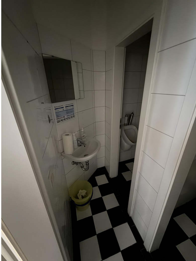
WC Herren OG