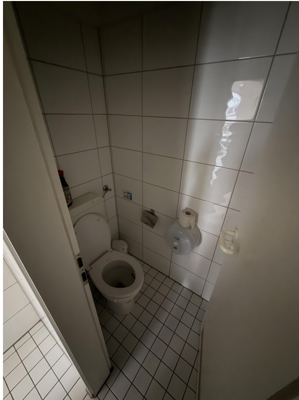
WC Damen OG