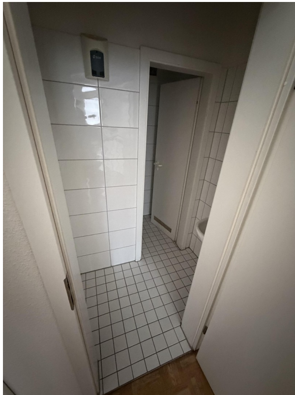
WC Damen OG