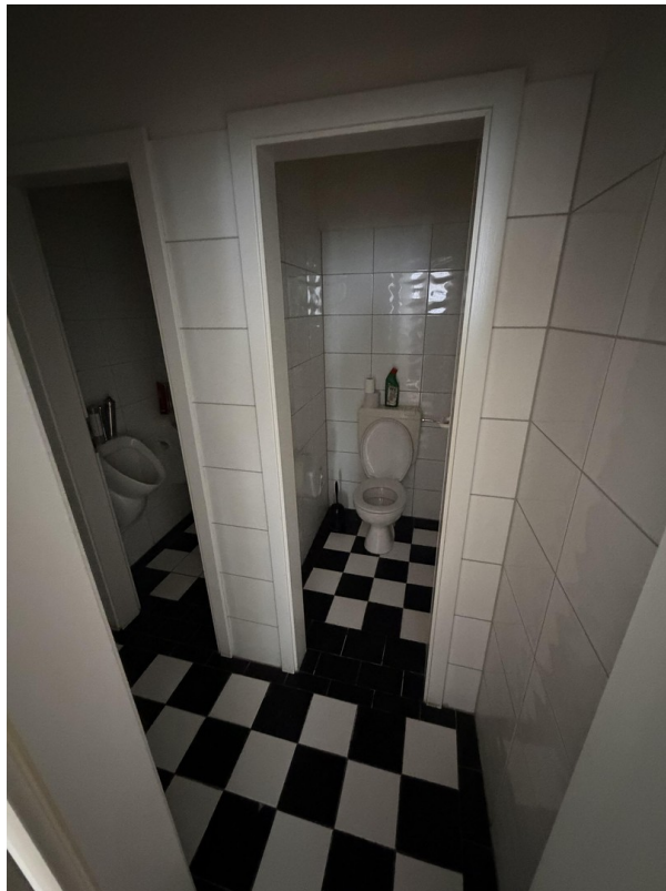
WC Herren OG