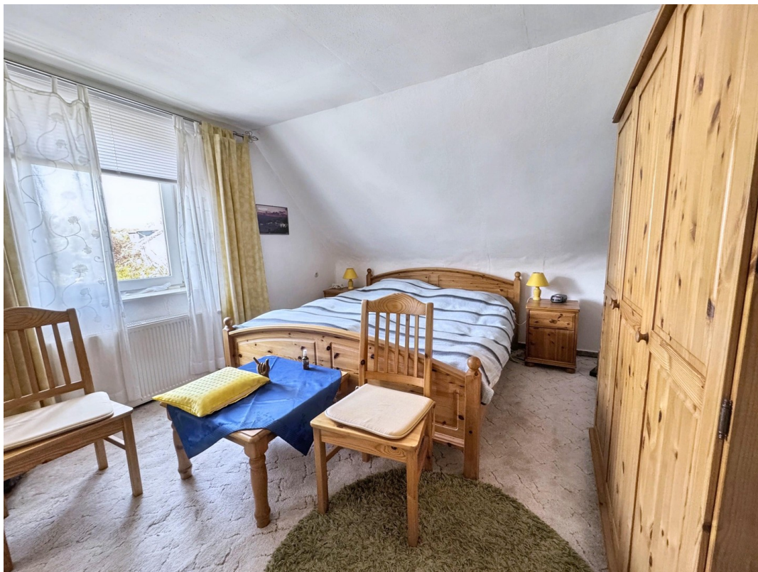
Zimmer 1 Dachgeschoss