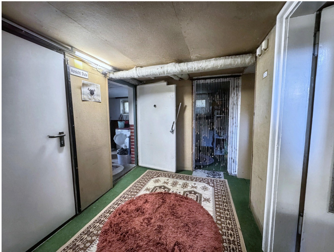
Blick in den Keller