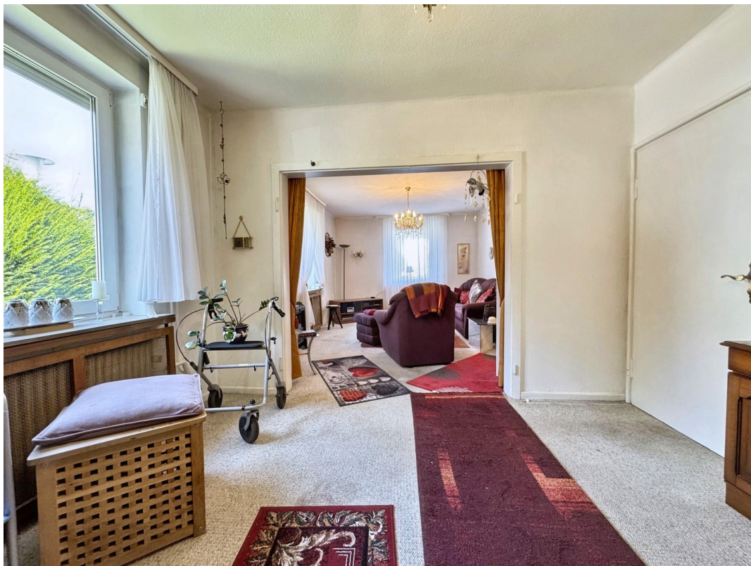
großes Wohnzimmer EG