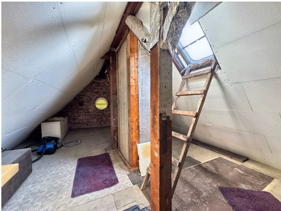
Blick in den Spitzboden