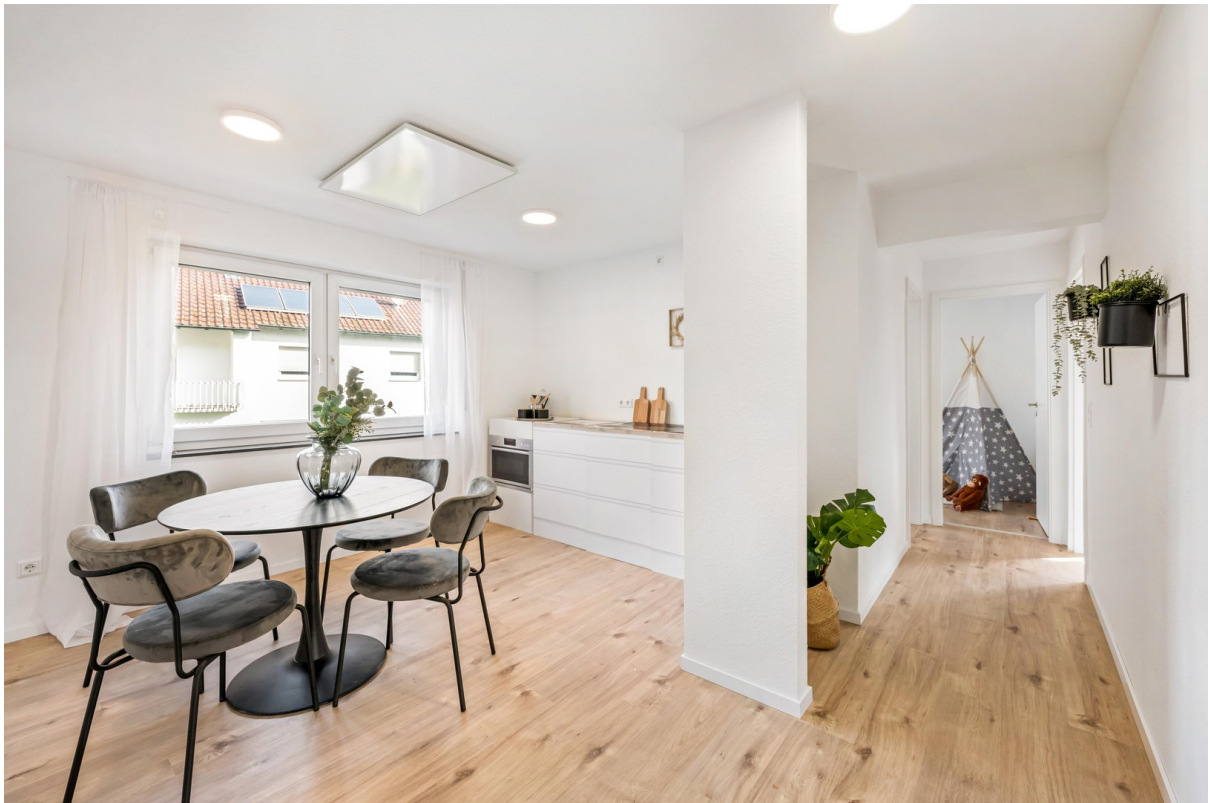
Küche und Flur