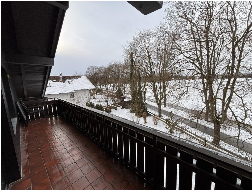
Ausblick vom Balkon