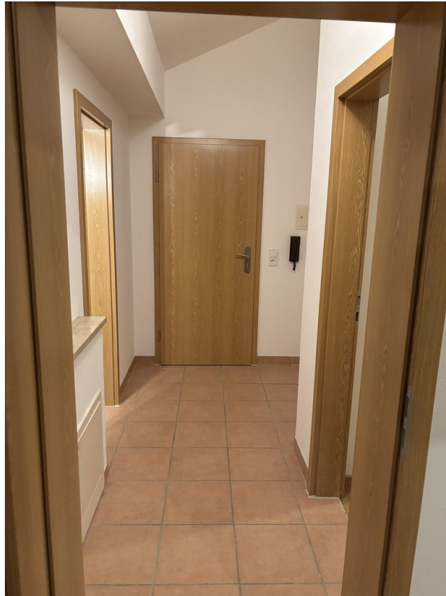
Flur Blickrichtung Eingangstür