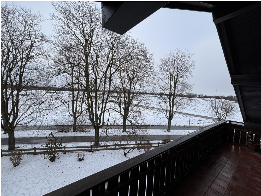
Ausblick vom Balkon