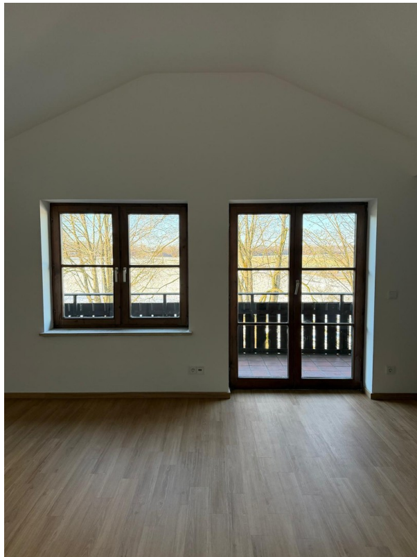
Balkontür im Wohnzimmer