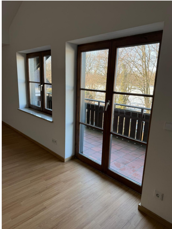
Balkontür im Wohnzimmer