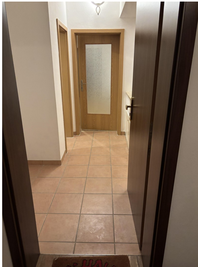
Eingangsbereich zur Wohnung