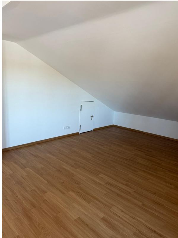
Kriechspeicher im Wohnzimmer