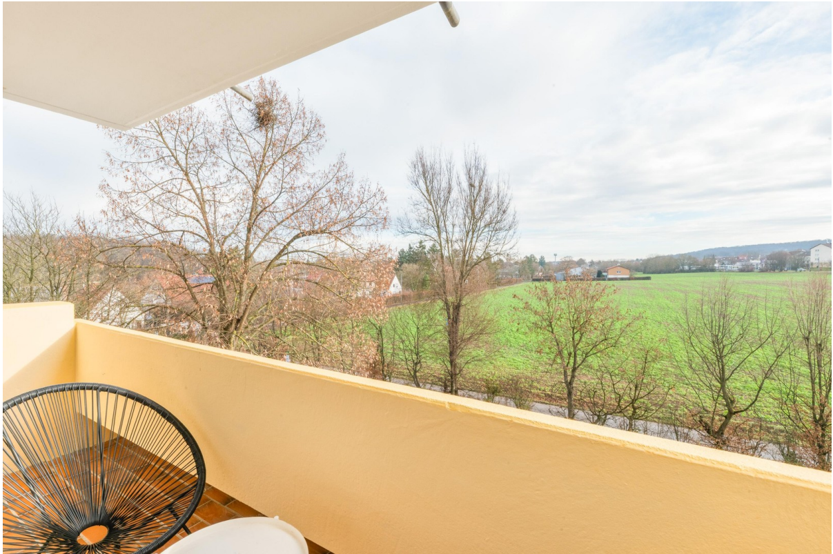
Blick ins Grüne