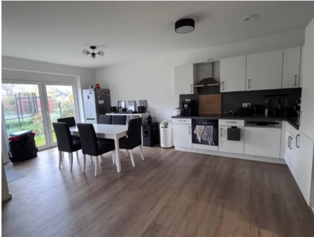
offener Ess- u. Küchenbereich