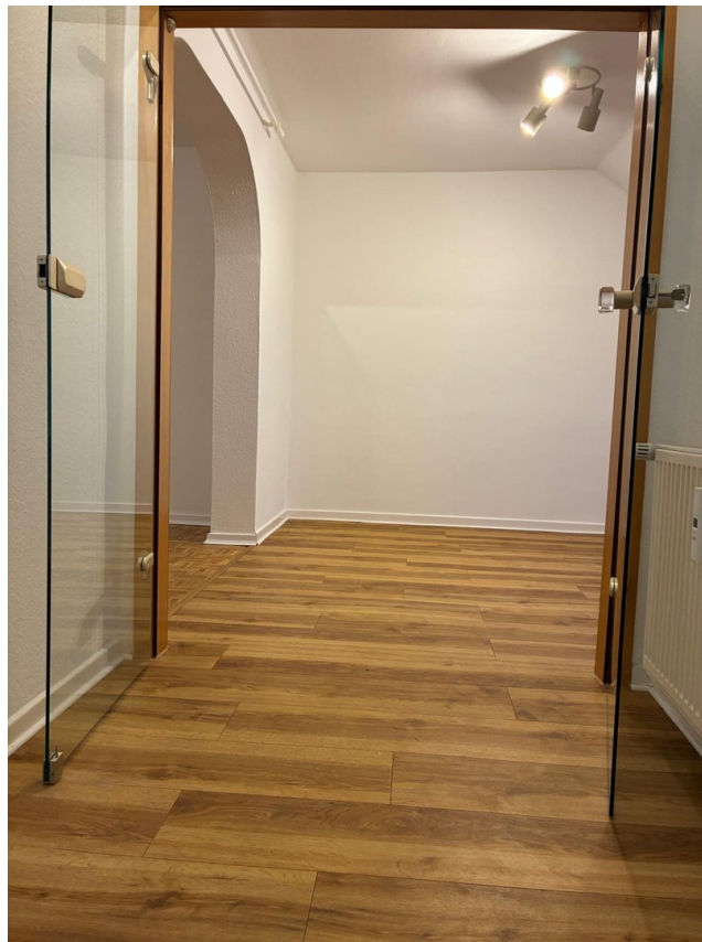
Glastür zw Flur & Esszimmer