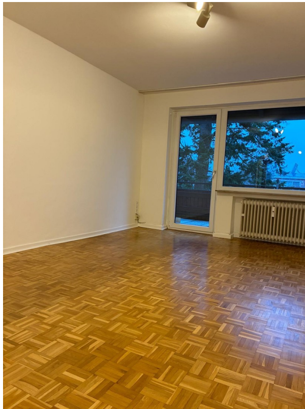
helles Wohnzimmer mit Balkon