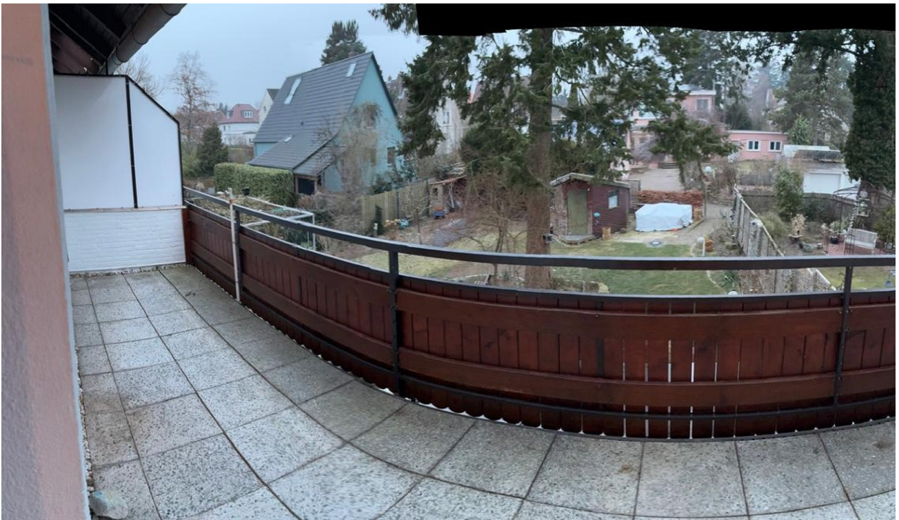
Balkon mit Blick ins Grüne