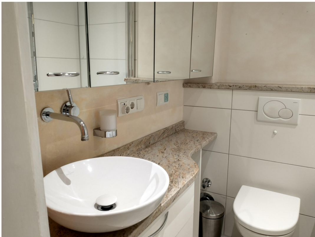
Badezimmer - Naturstein