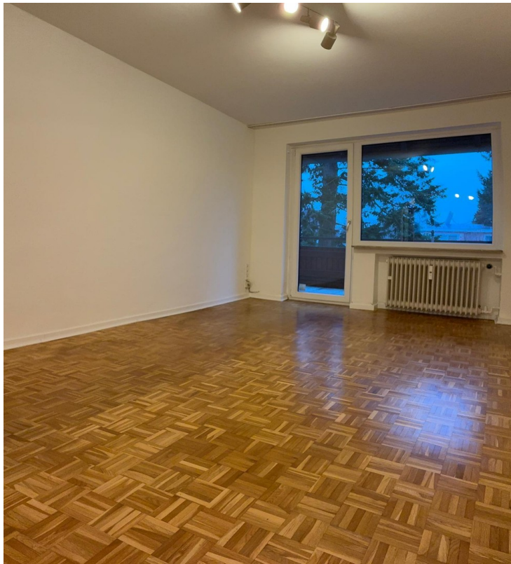
helles Wohnzimmer mit Parkett