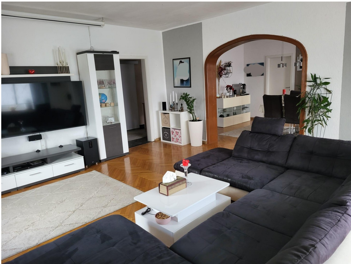
Wohnzimmer mit durchgangsbogen