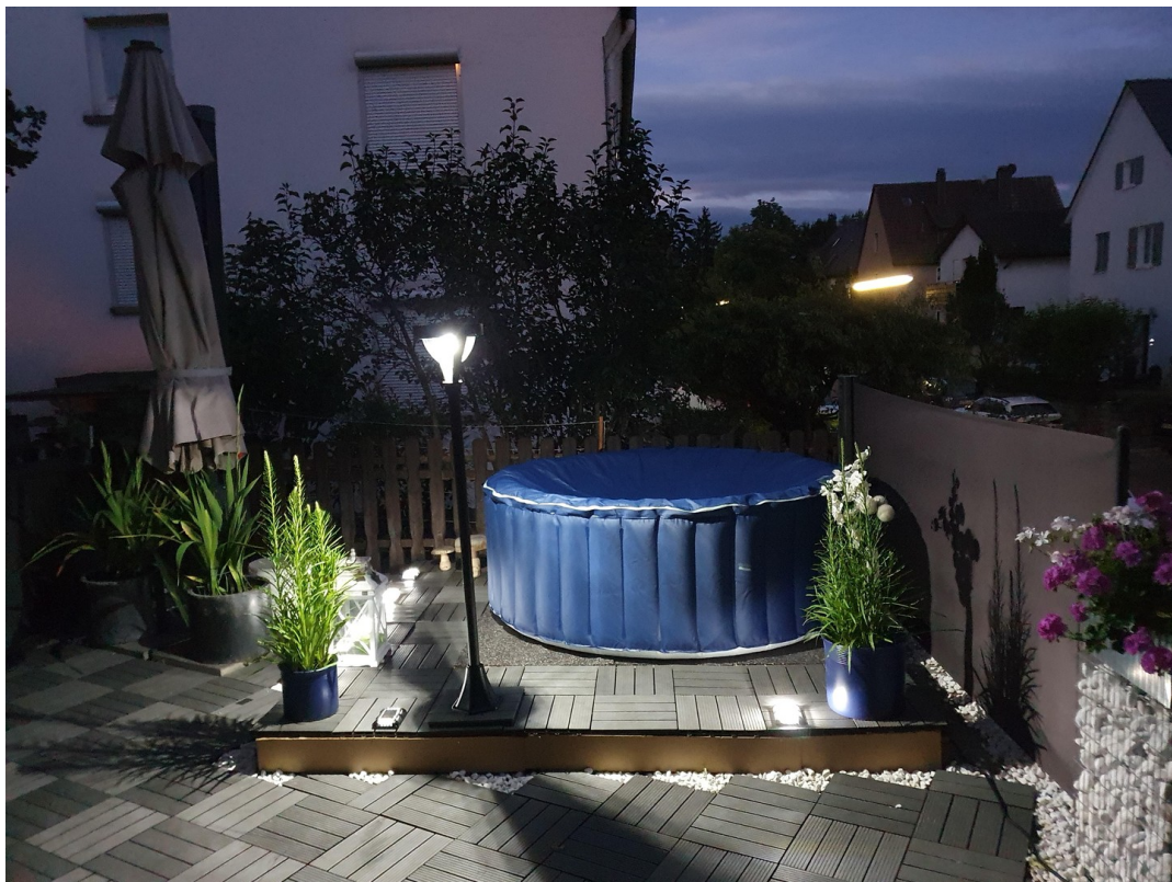
Terrasse bei Nacht