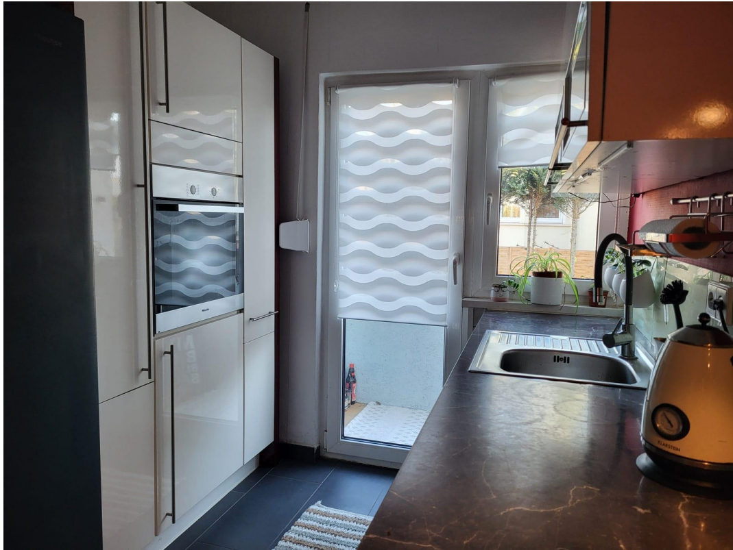
Küche Bild 2