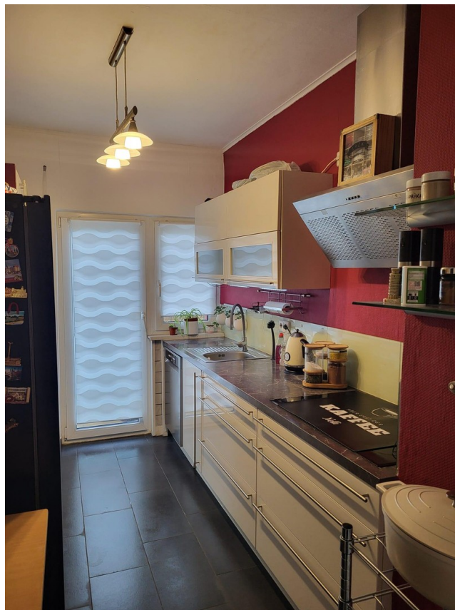
Küche Bild 1