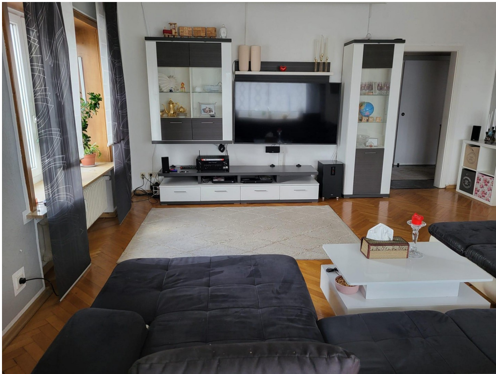
Wohnzimmer Bild 3