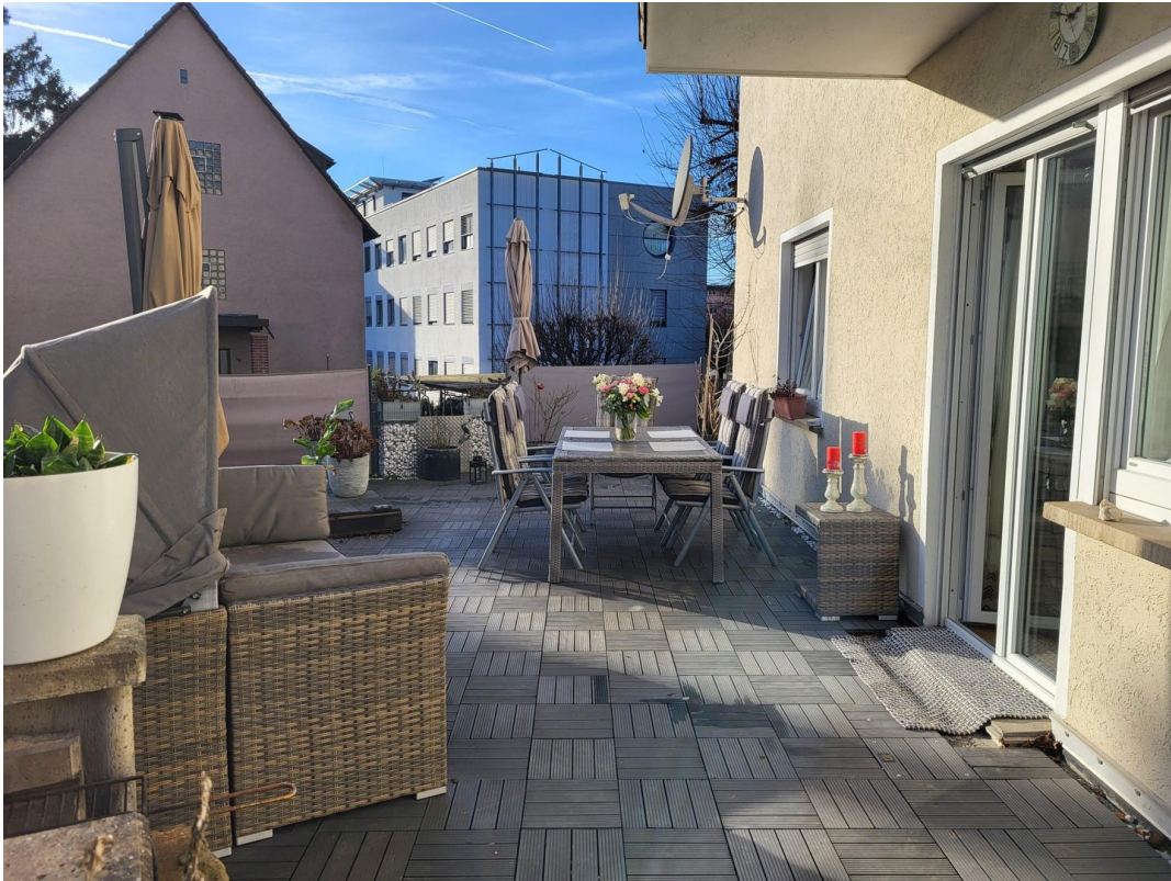
Terrasse Bild 1