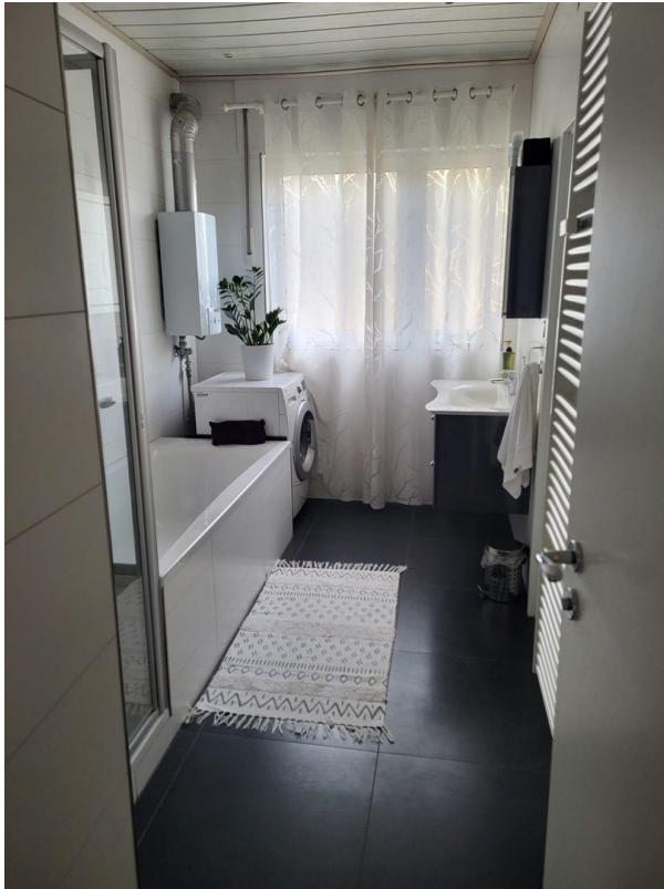
Bad Bild 1