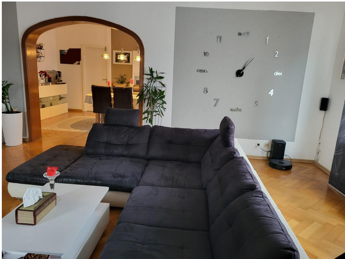
Wohnzimmer Bild 2