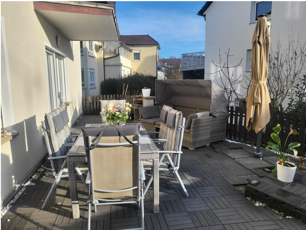
Terrasse Bild 2