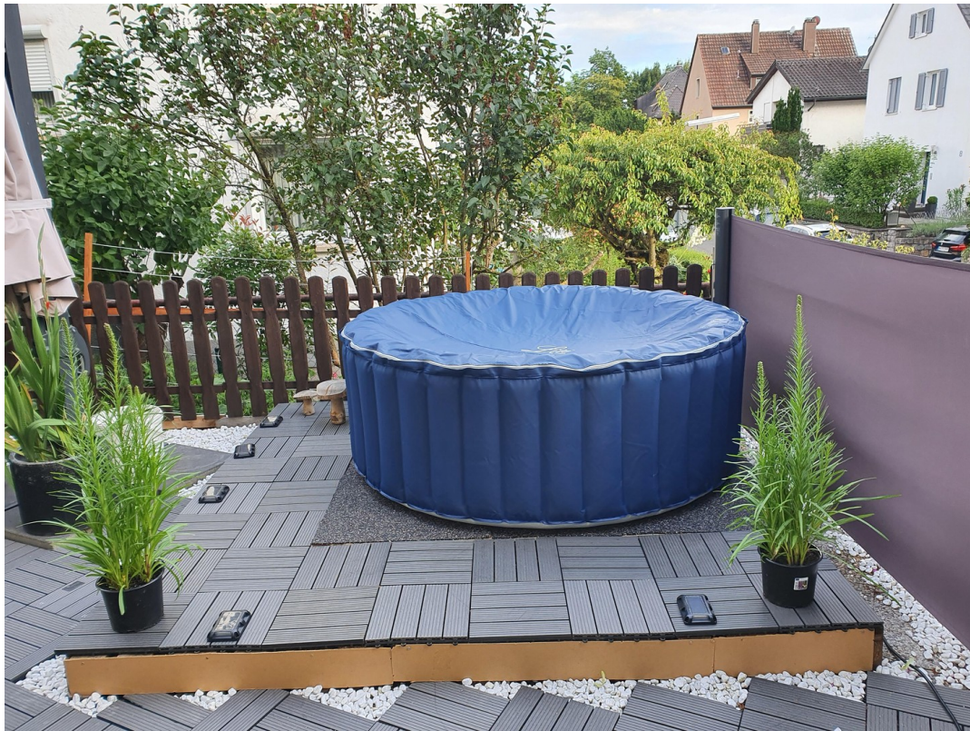
Terrasse im Sommer