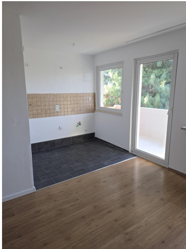
Küche / Wohnzimmer