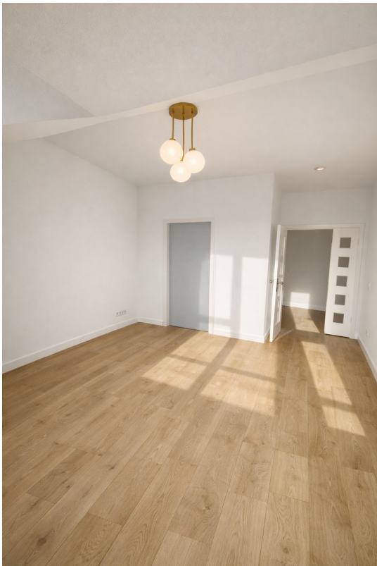
Wohzimmer zur Küche