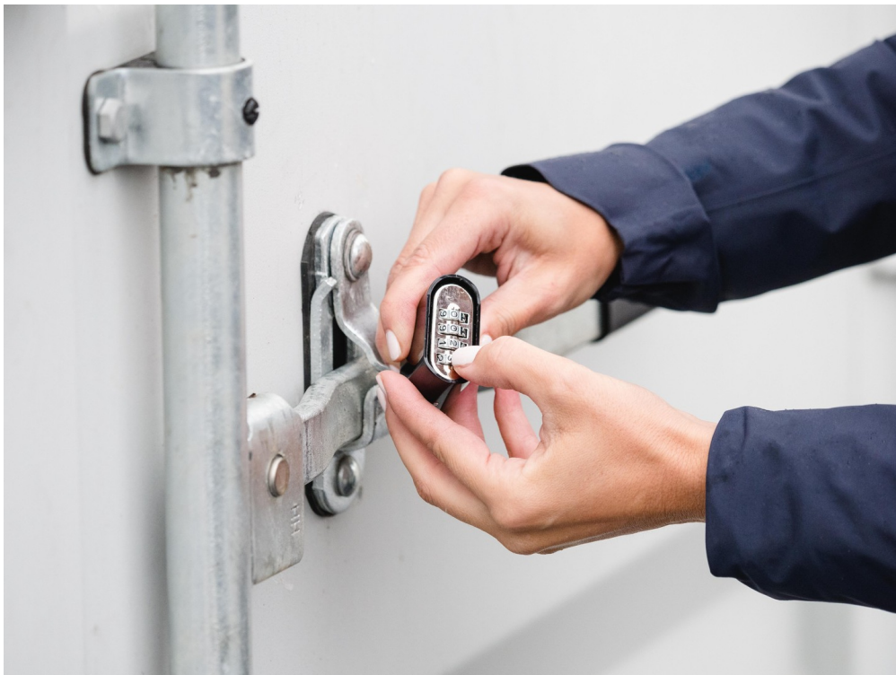
Zugangscode per Email