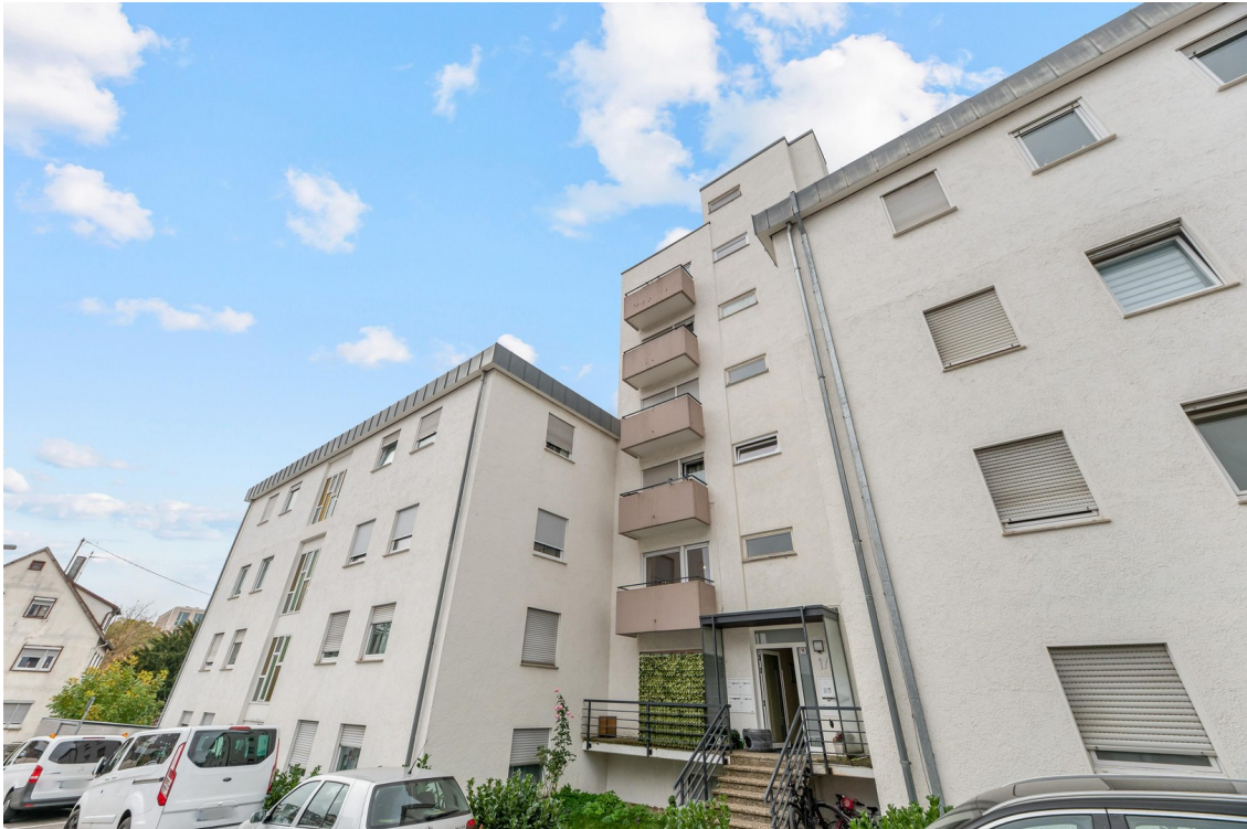
Hausansicht mit Eingang