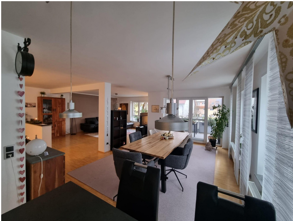
Blick aus der Küche