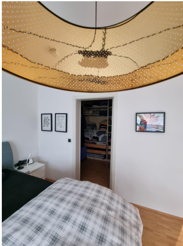
Schlafzimmer mit Ankleide