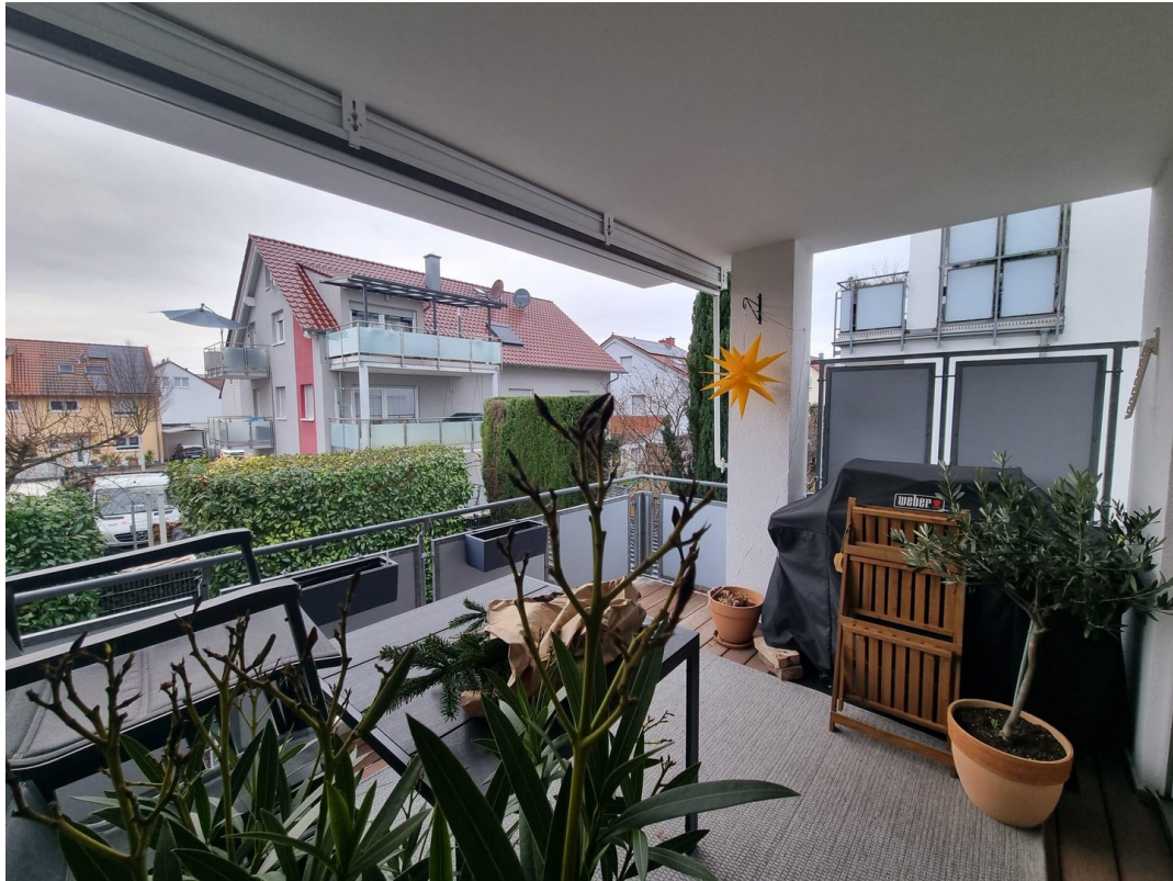
Balkon mit Aussicht