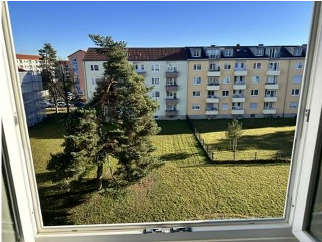
Blick in den Innenhof n. Osten