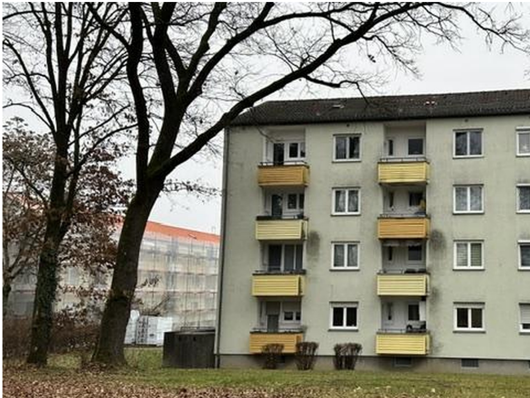
Hausansicht von Westen