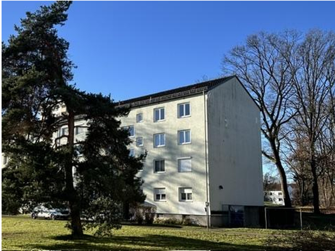
Hausansicht von Osten