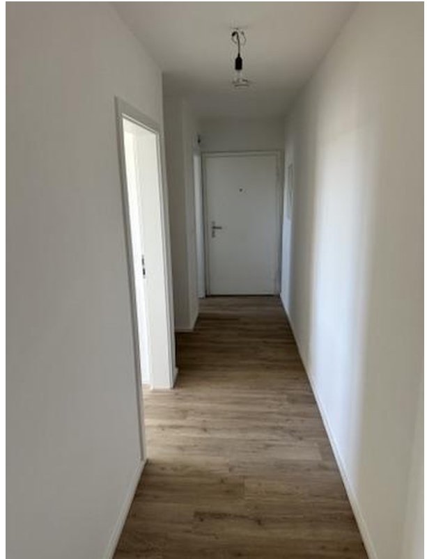
Blick zurück zur Haustüre