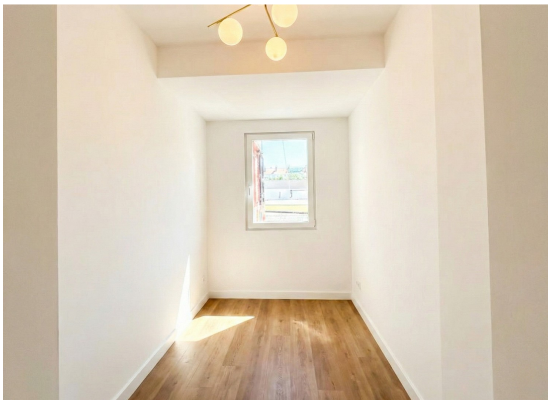
Schlafzimmer, Doppelbett passt