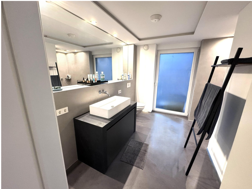
Bad mit bodentiefen Fenster