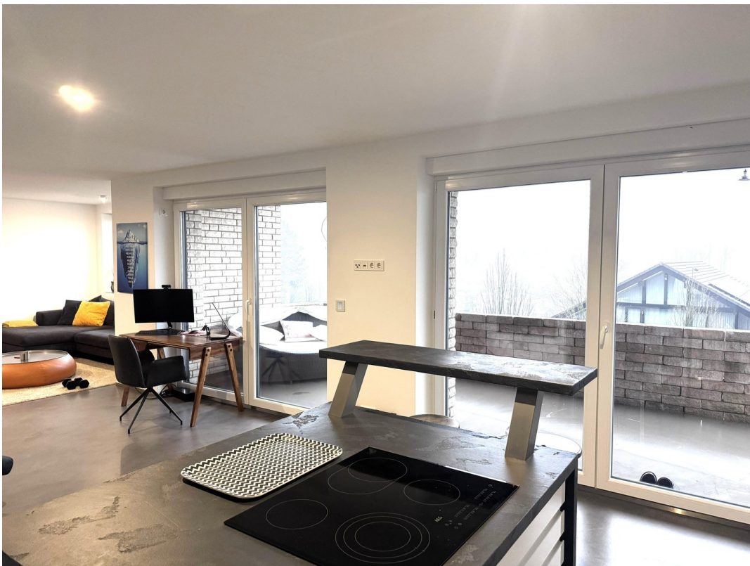
Offen und hell