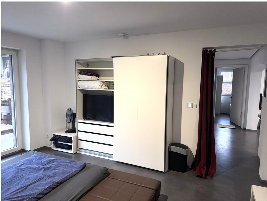
Schlafzimmer groß, hell, ruhig