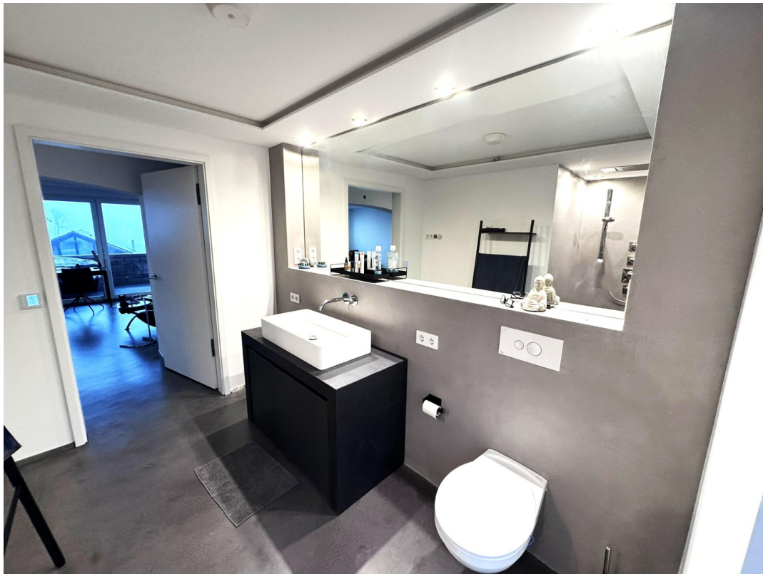
Große beleuchtete Spiegelfront