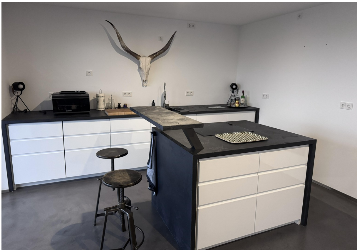
Maßgefertigte Küche mit Insel