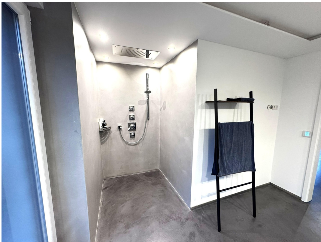
Große ebenerdige Dusche