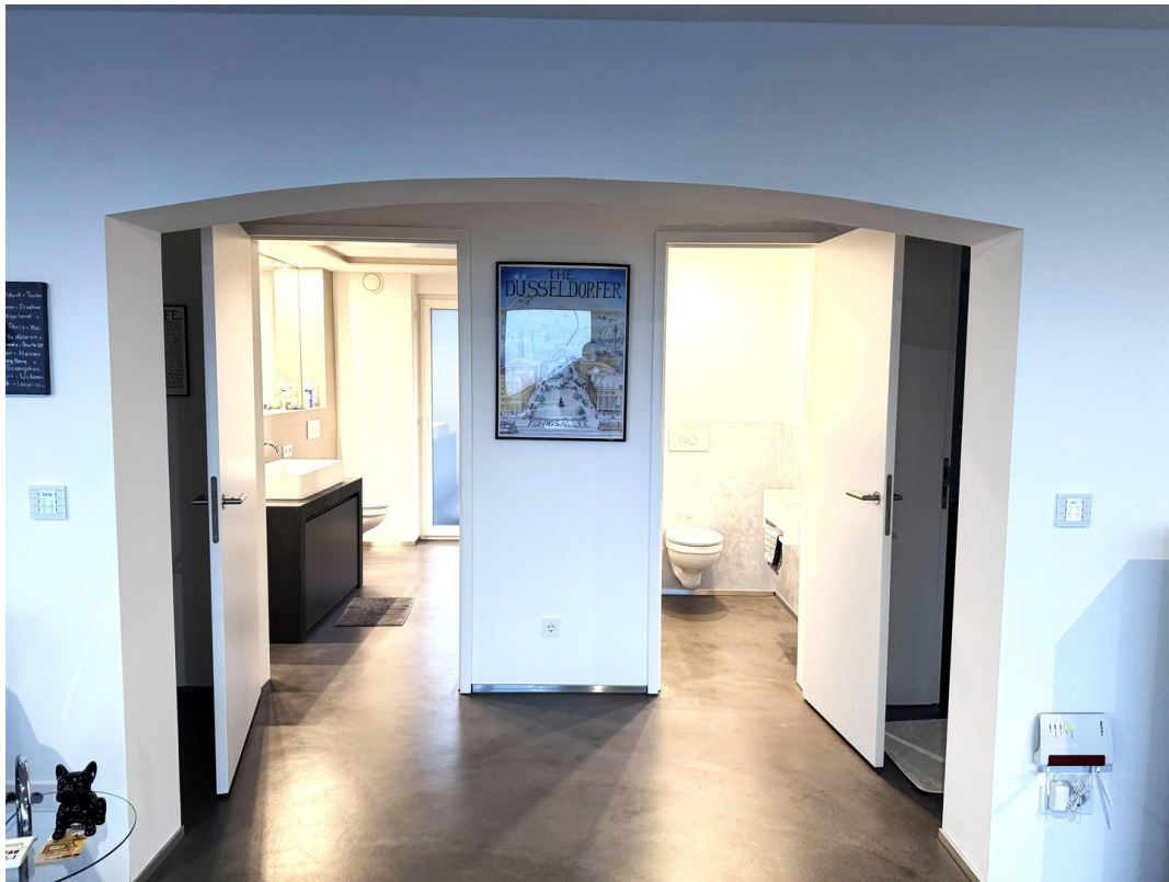
Masterbad und Gäste-WC