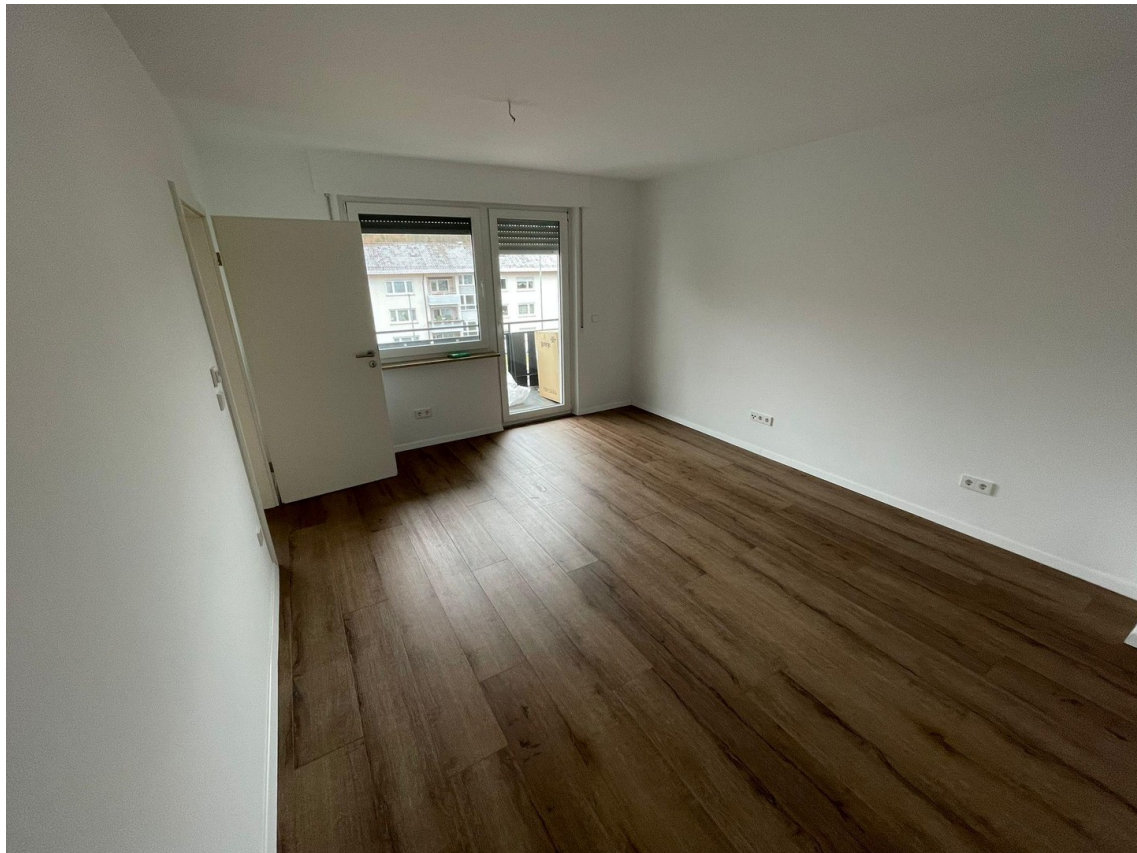
Schlafzi. mit Blick zum Balkon