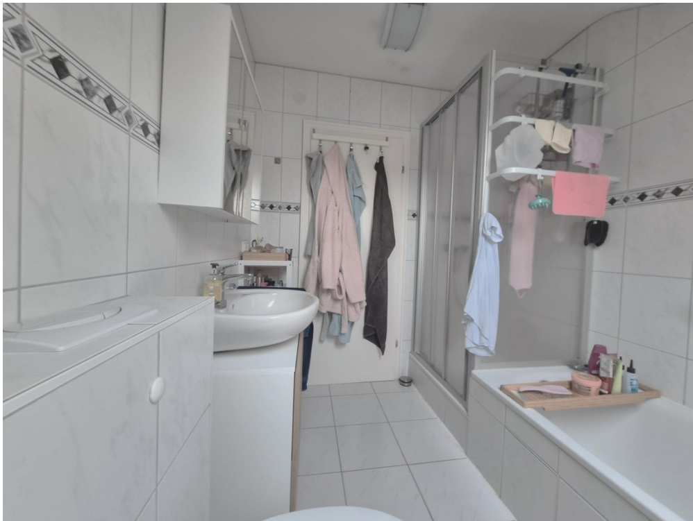
mit Wanne & Dusche