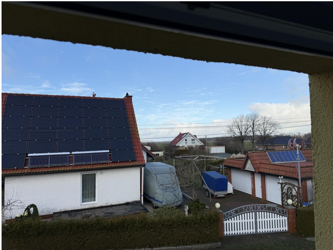
Blick Zum Hoff vom OG