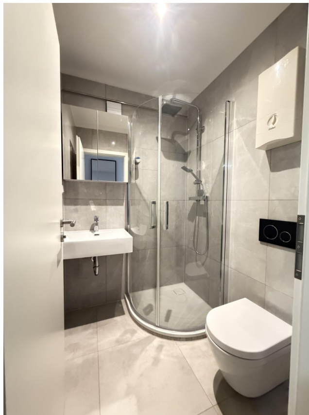
Geste WC mit Dusche