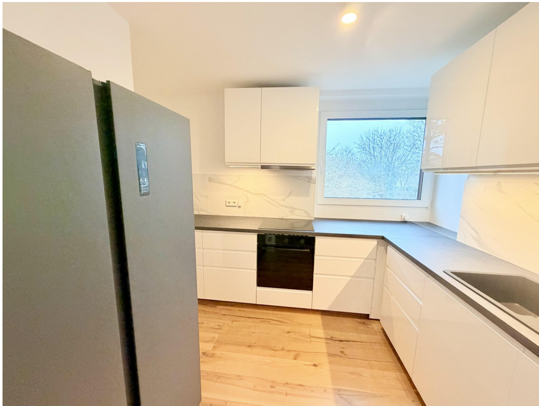
Küche komplett Ausstattung