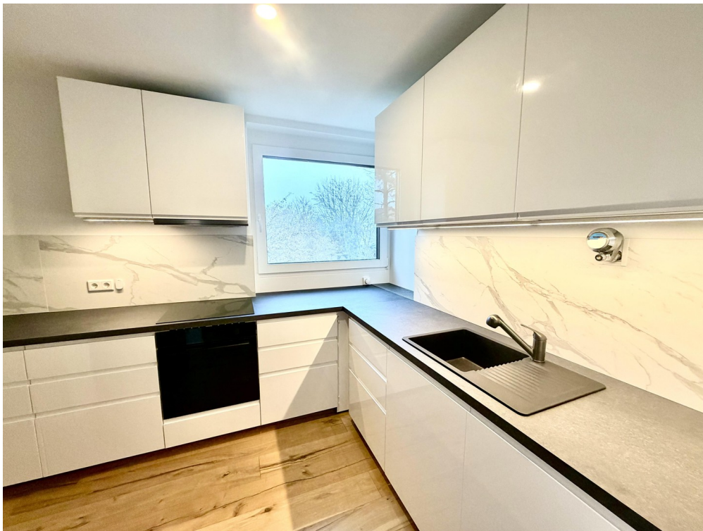
Mit alle Geräten ausgestattet