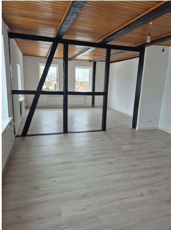
Wohn- u. Esszimmer