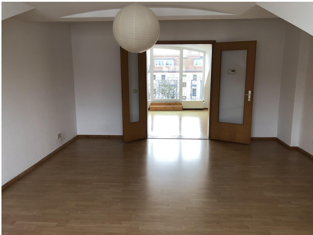
Wohnzimmer (25,94 qm)