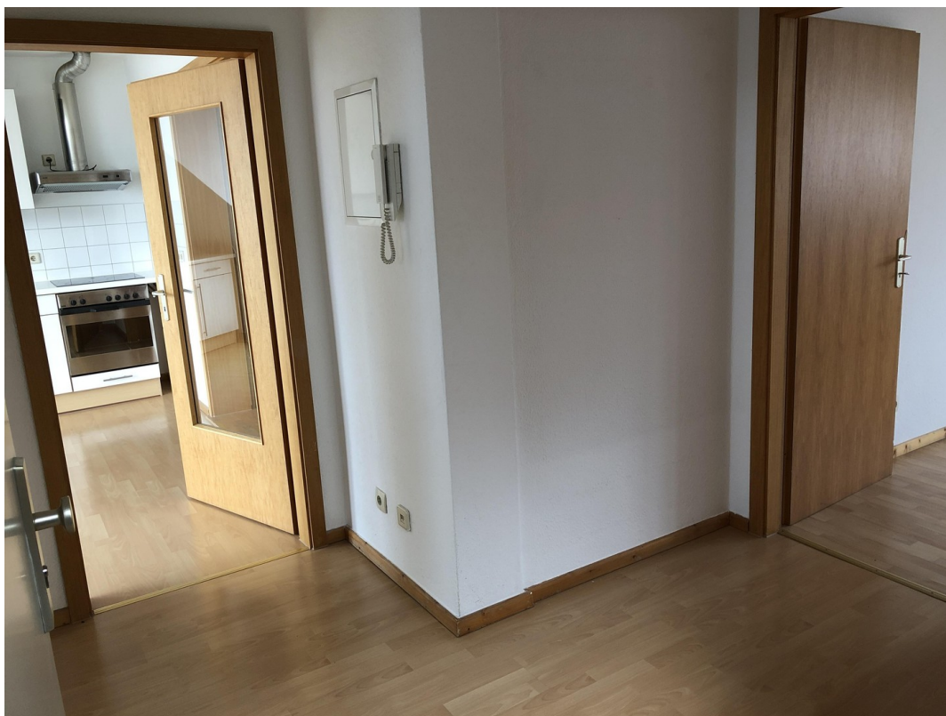
Flur (6,50 qm)