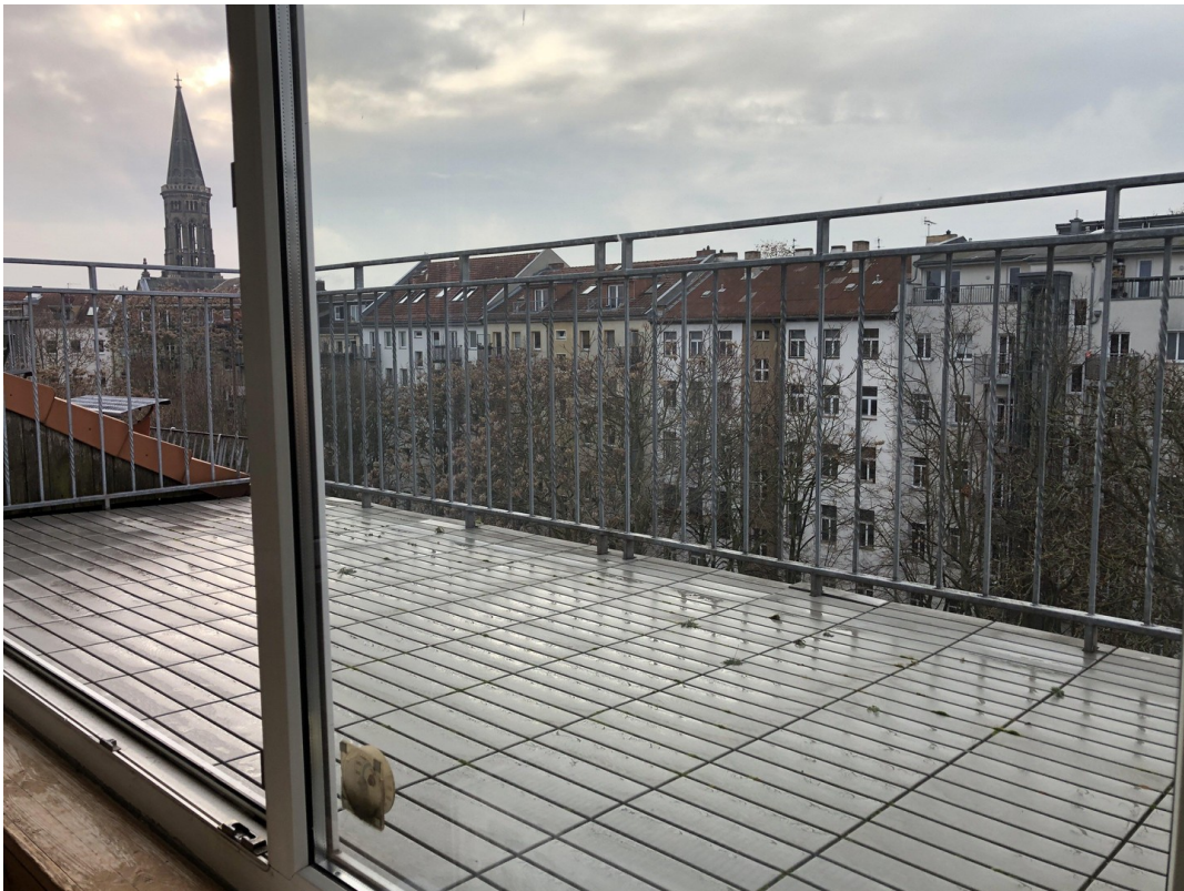
Dachterrasse (4,65 qm)