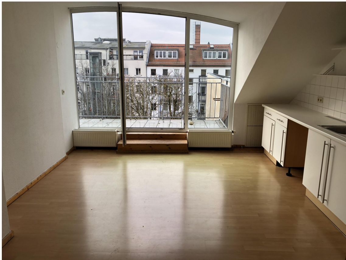
Wohnküche (16,17 qm)