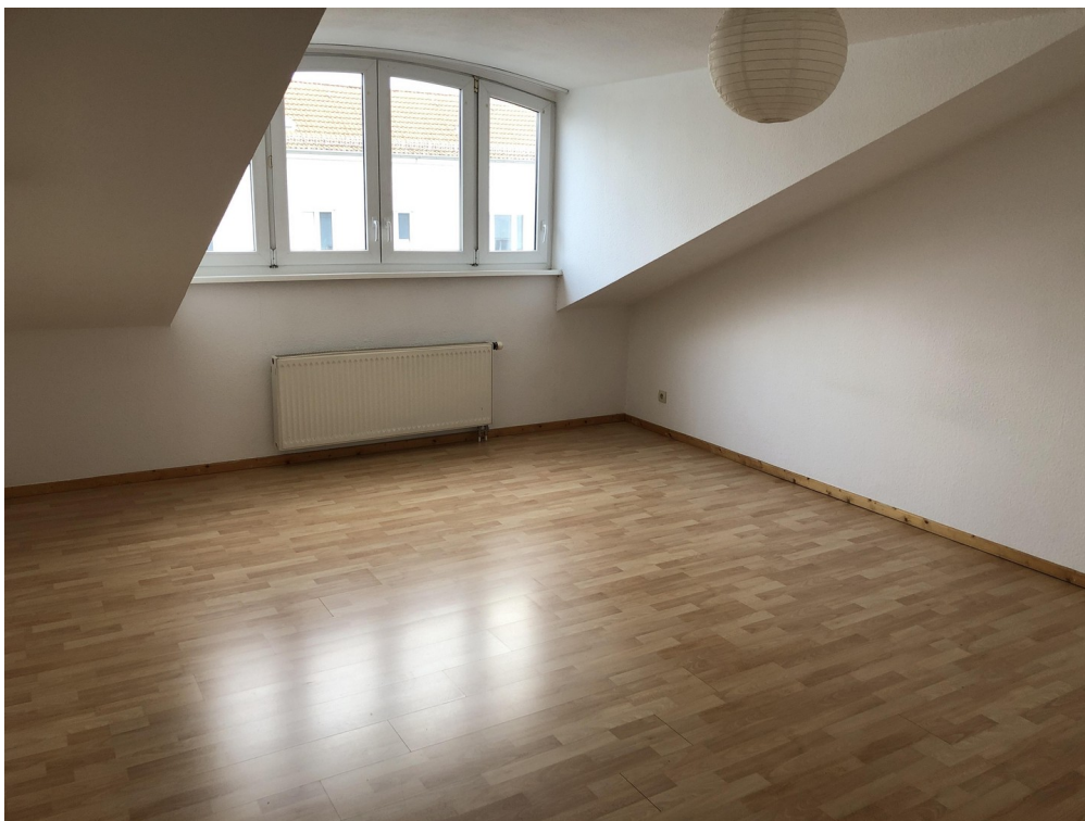
Schlafzimmer (18,38 qm)