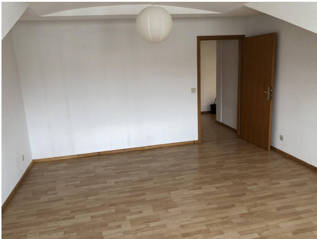
Schlafzimmer (18,38 qm)