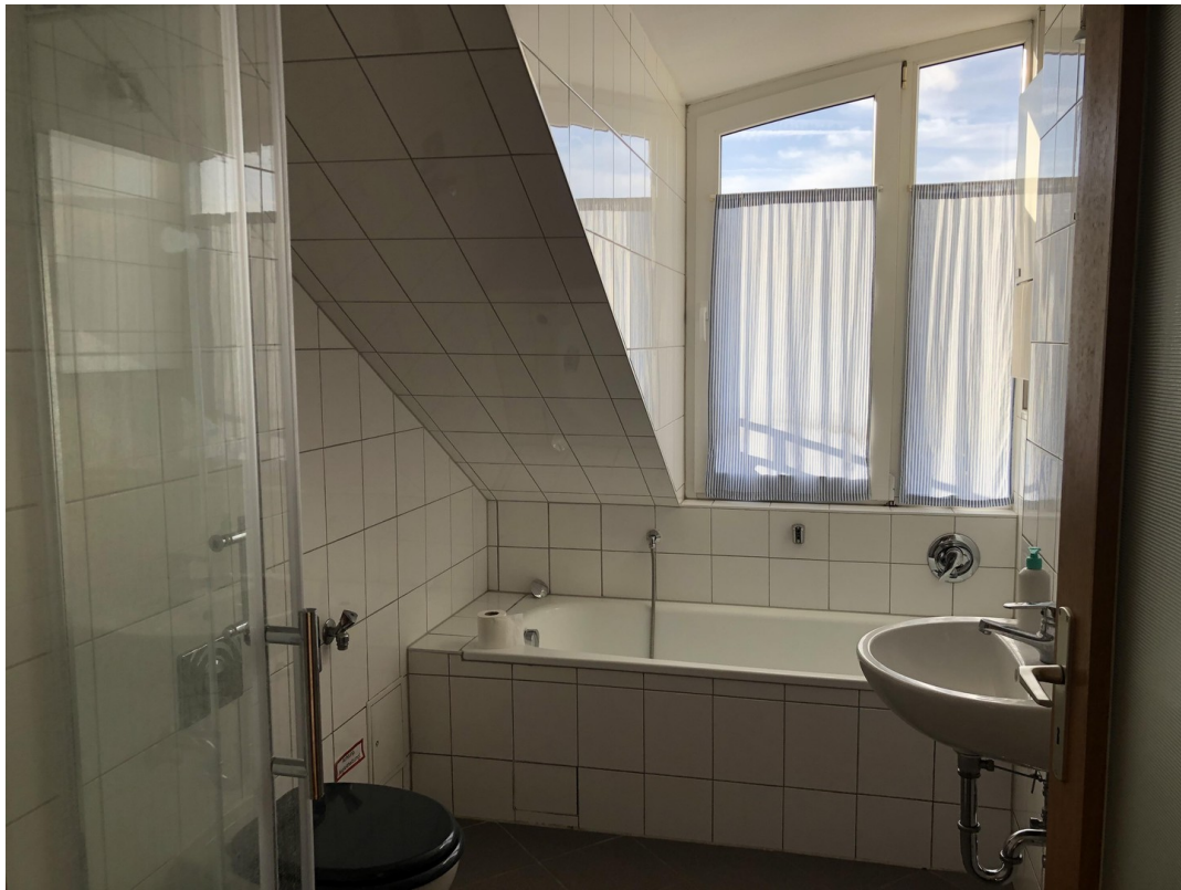
Bad (4,39 qm)