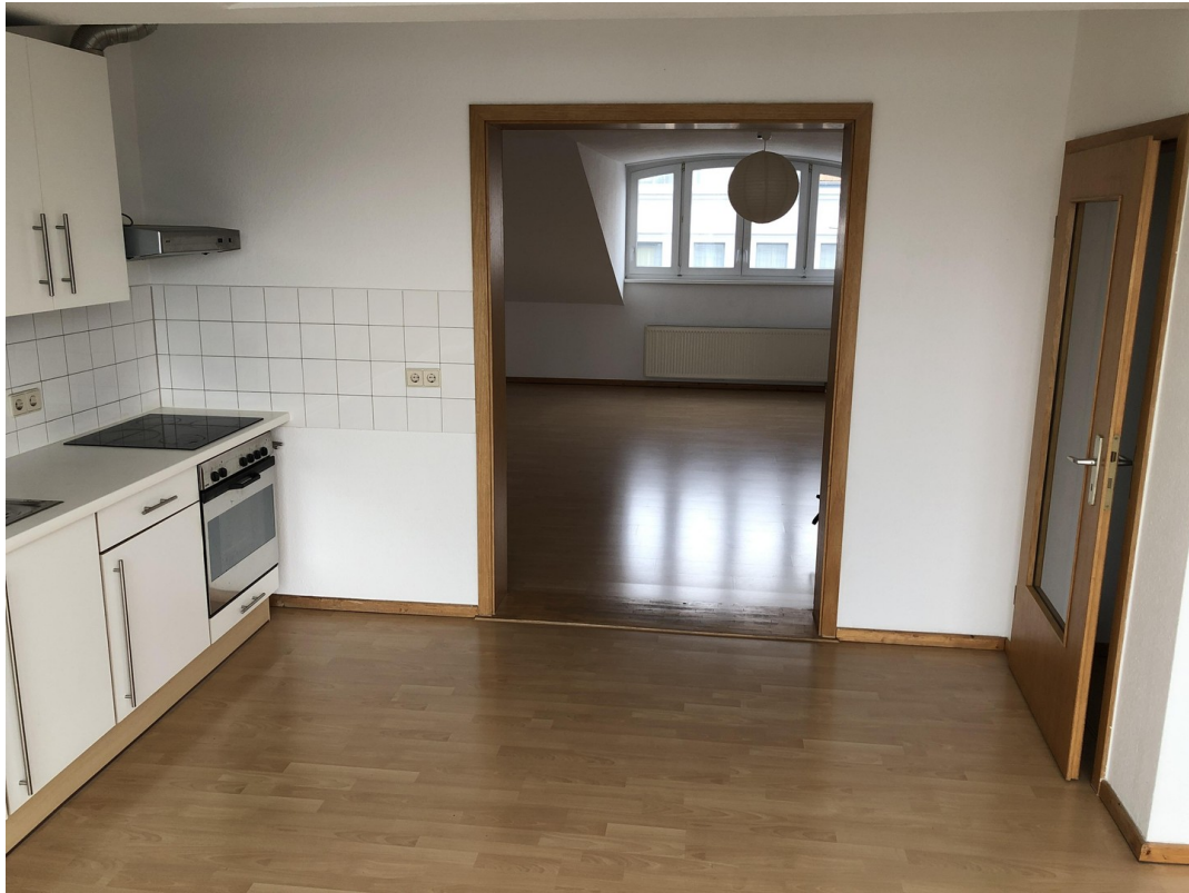
Wohnküche (16,17 qm)