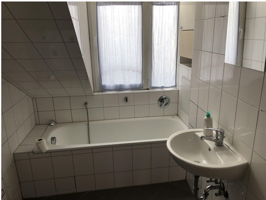
Bad (4,39 qm)