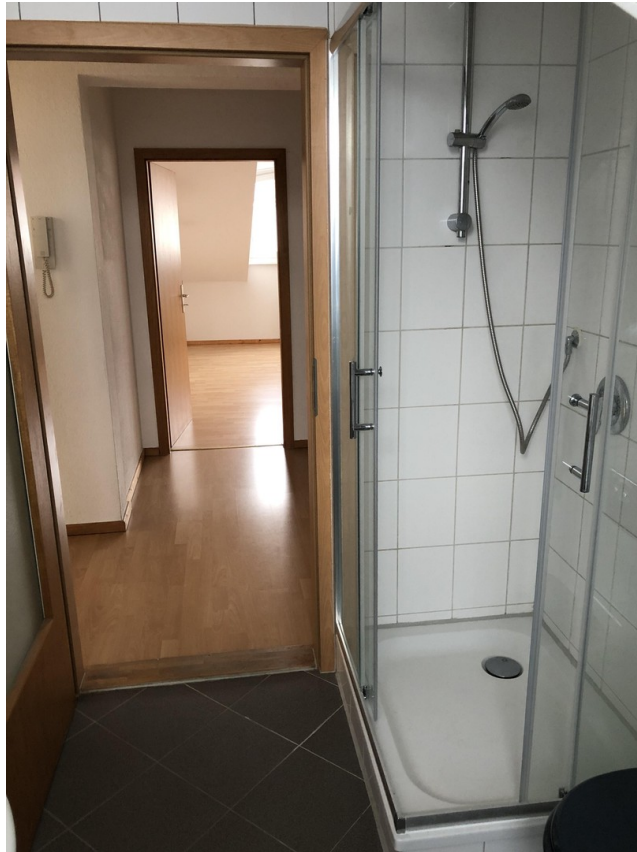
Bad (4,39 qm)