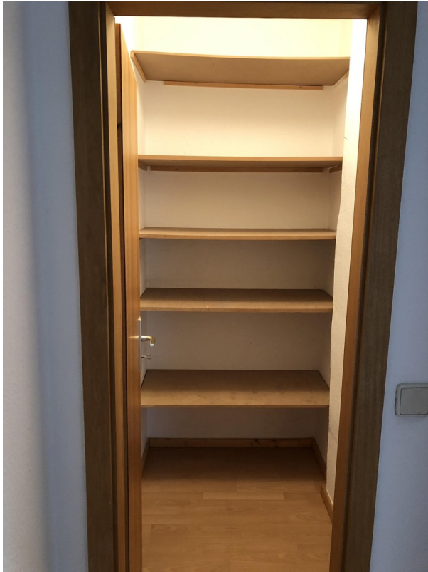
Abstellkammer (1,67 qm)