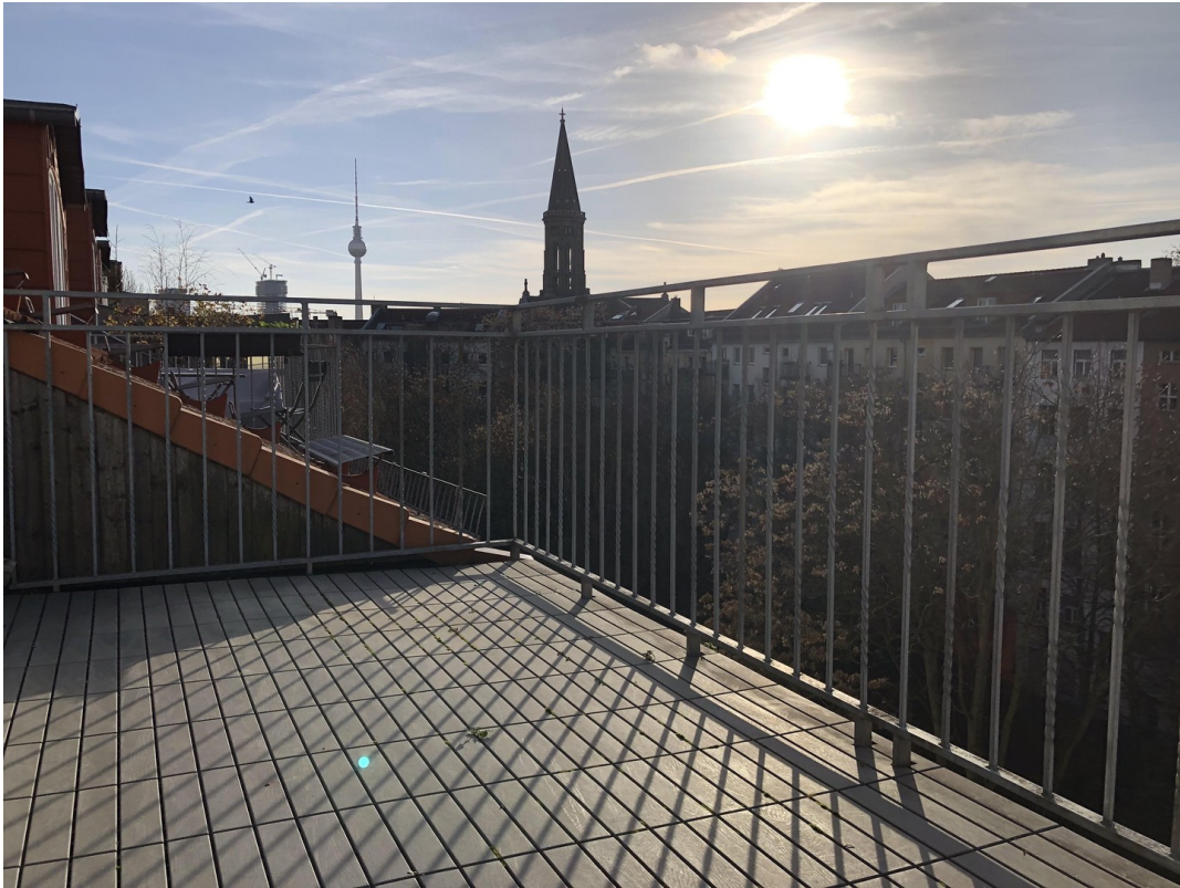
Dachterrasse (4,65 qm)