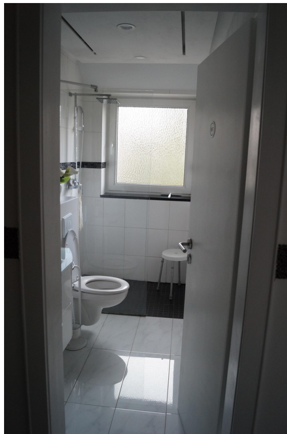
Gäste WC EG