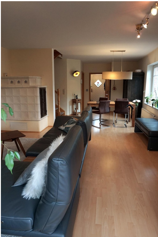
Wohnzimmer mit Kachelofen