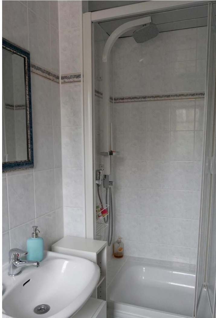
Gäste-WC mit Dusche