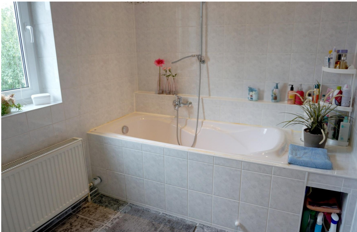
Hauptbad mit Badewanne