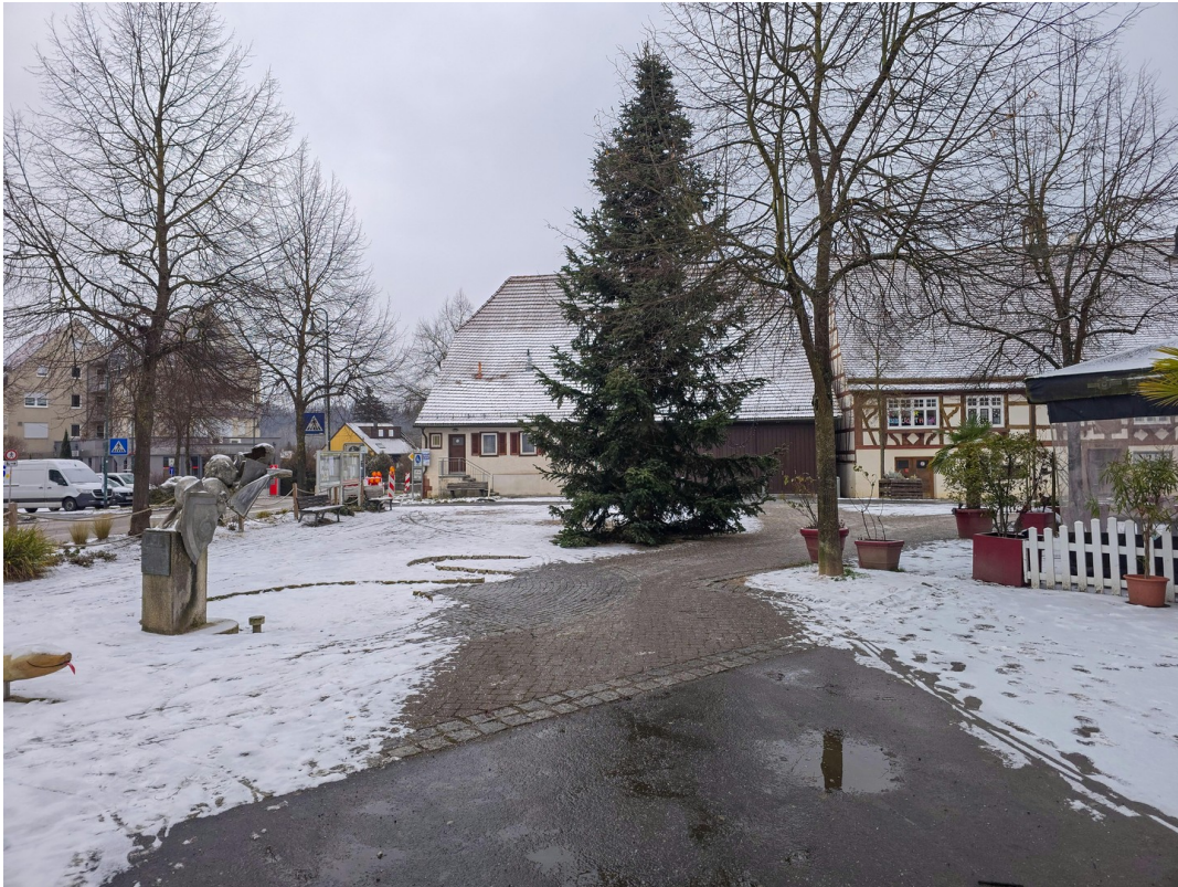
Die Aussicht nach draußen