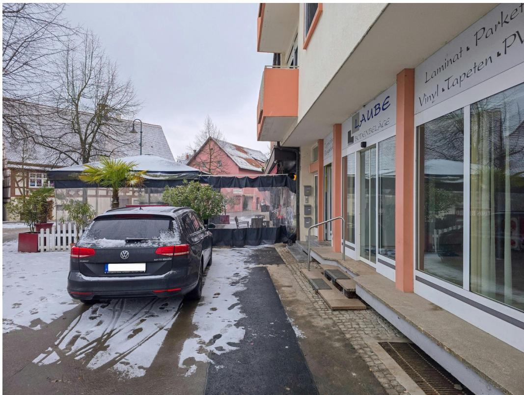
Treppenaufgang mit Schiebetür