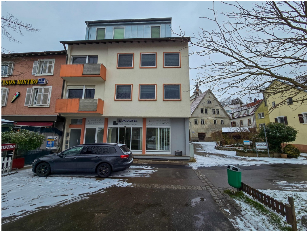
Das Gebäude von außen