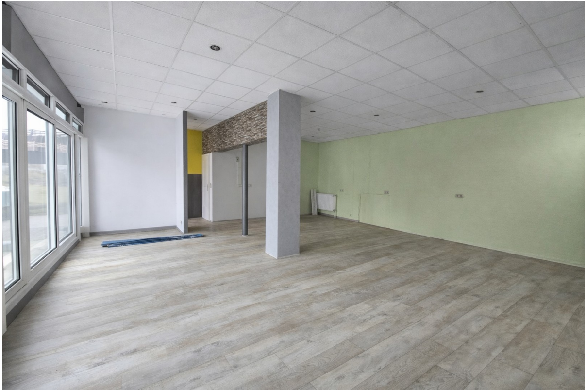
Viel Platz zur Gestaltung