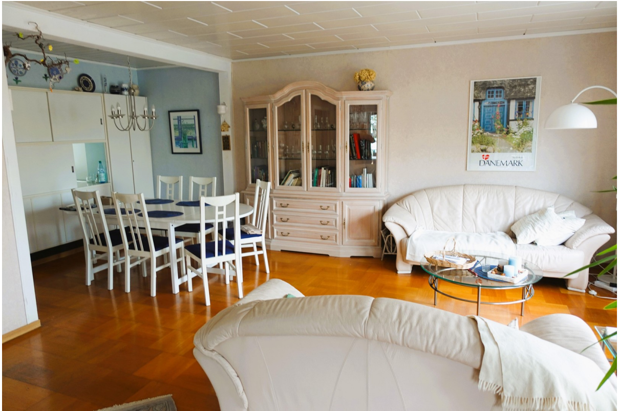
Wohnzimmer mit Eßbecke