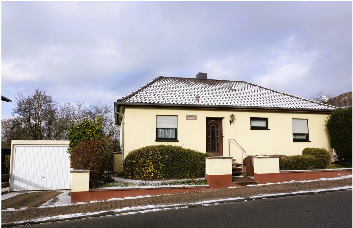
Vorderansicht mit Garage