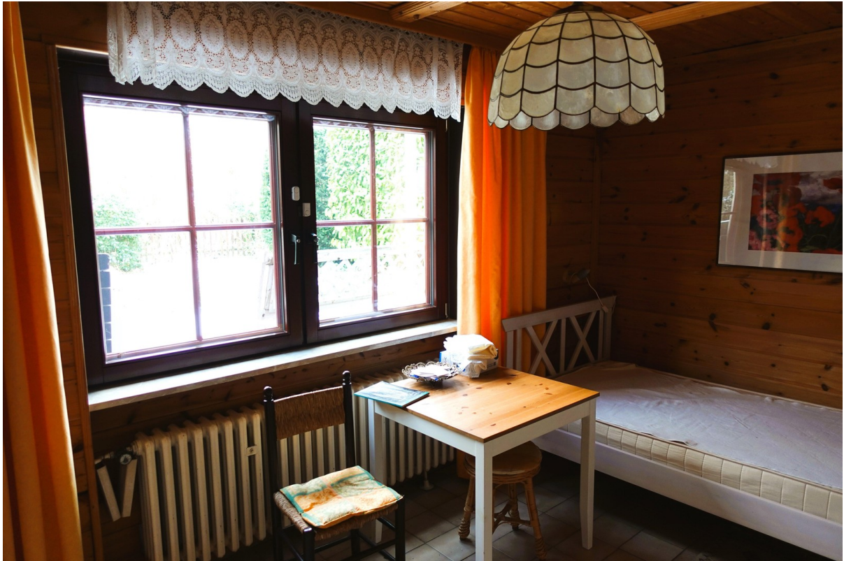
Zimmer im Kellerbereich