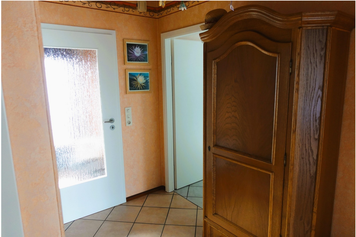
Eingangsbereich und Flur