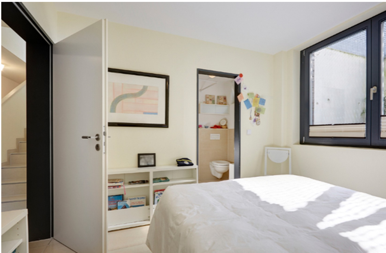
Gästezimmer / Ruheraum