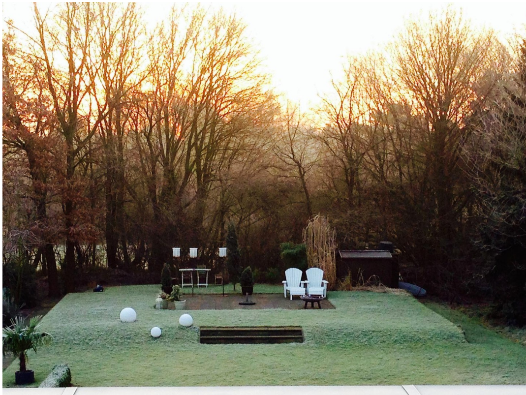
Blick aus Elternschlafzimmer