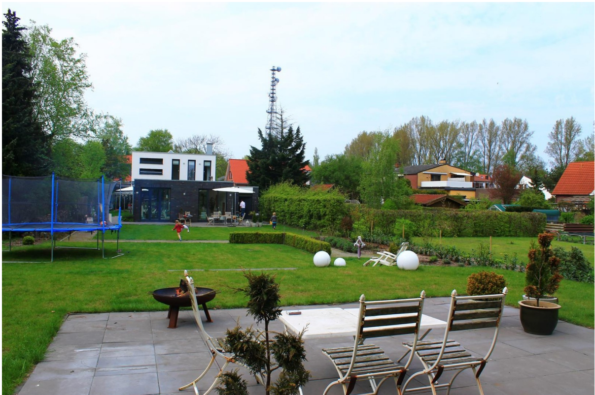
Gartenansicht von 3.Terrasse