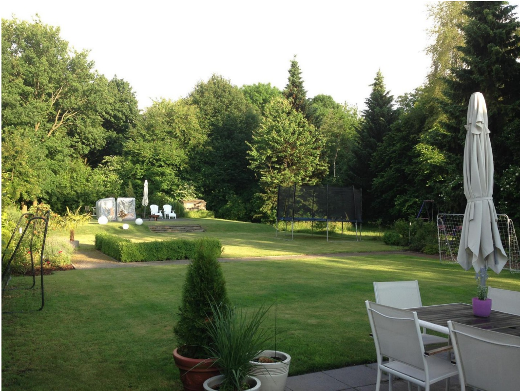
Gartenansicht v. Südostterrass