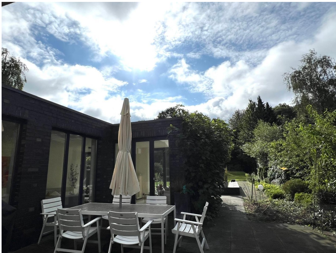
Südwestterrasse / Patio