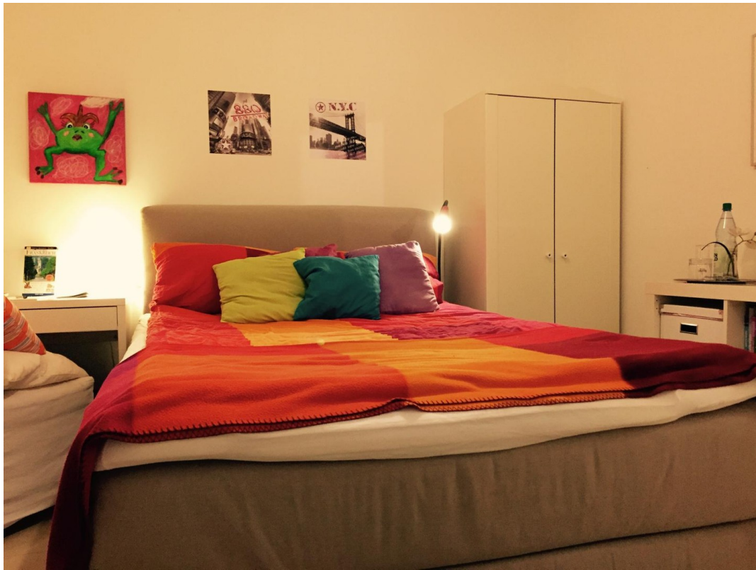
Gästezimmer / Ruheraum