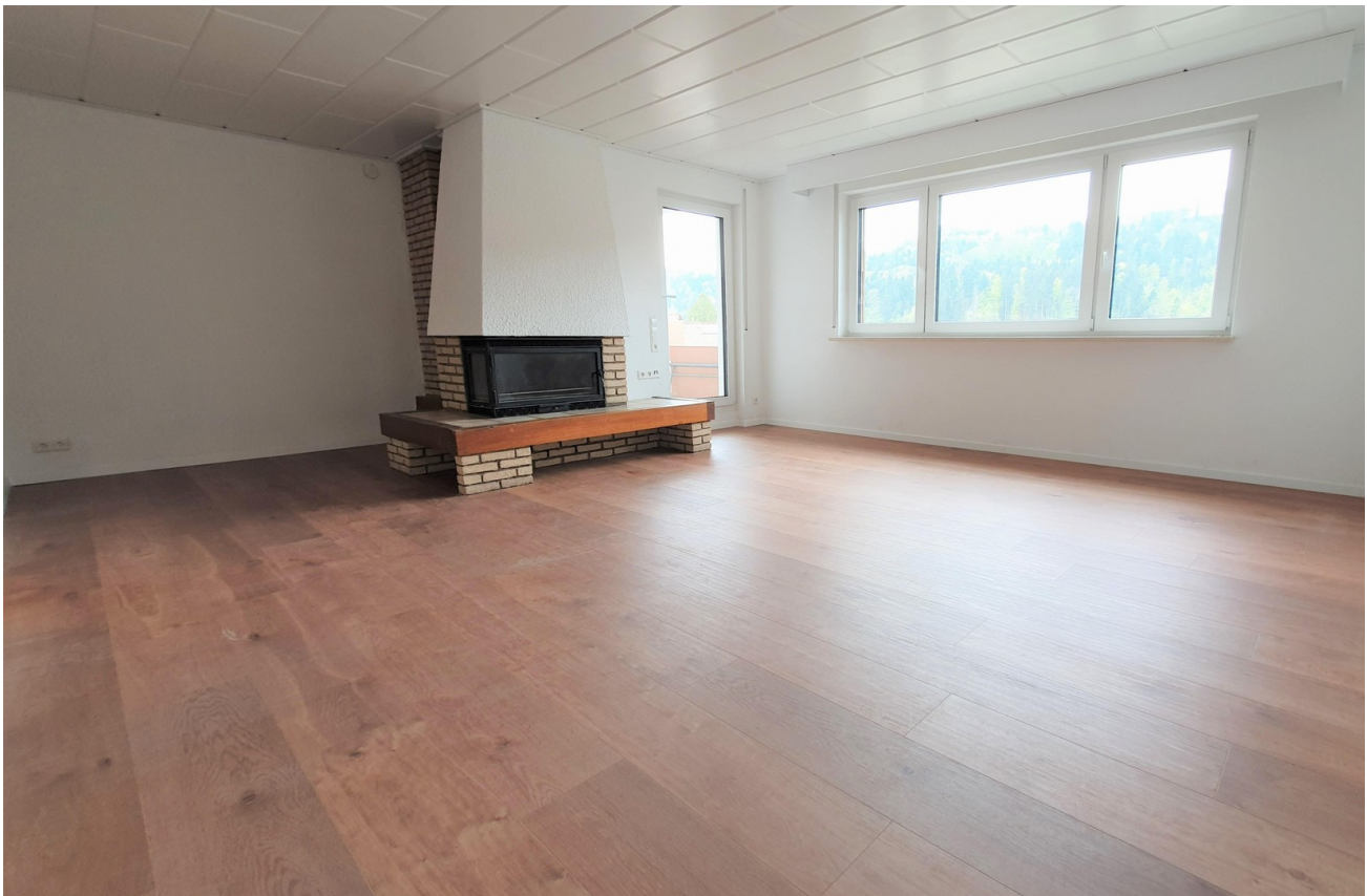
Wohnbereich mit Kamin