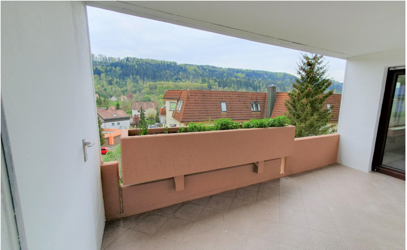
Balkon mit toller Aussicht