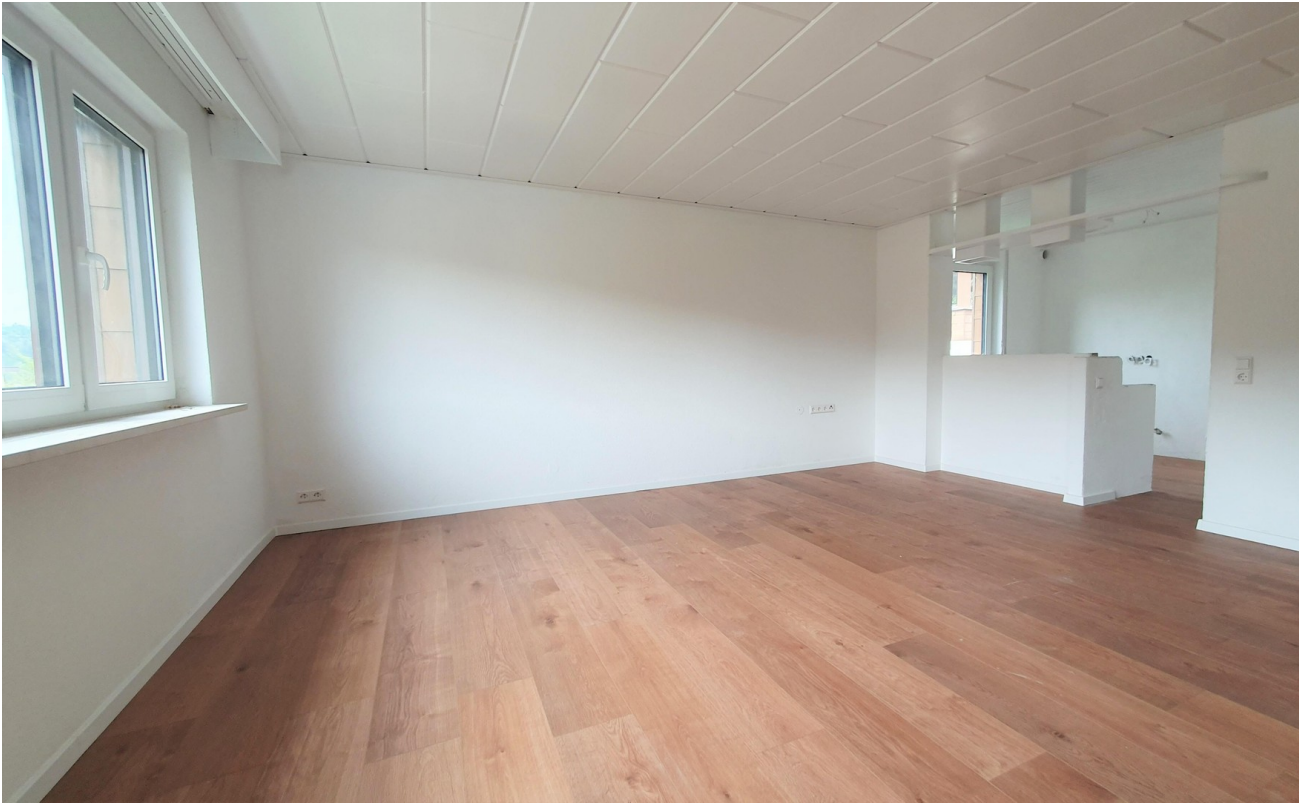
Wohnbereich mit offener Küche