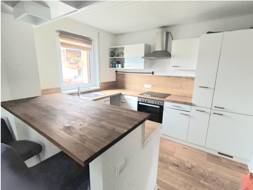
Offene Küche mit Einbauküche