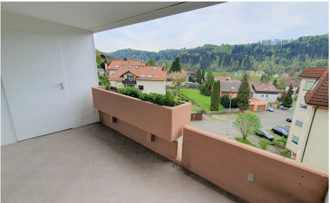
Balkon mit toller Aussicht