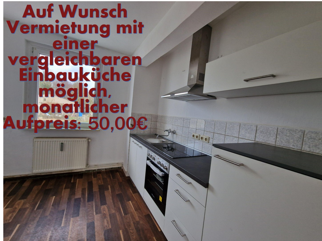
Optional mit EBK möglich