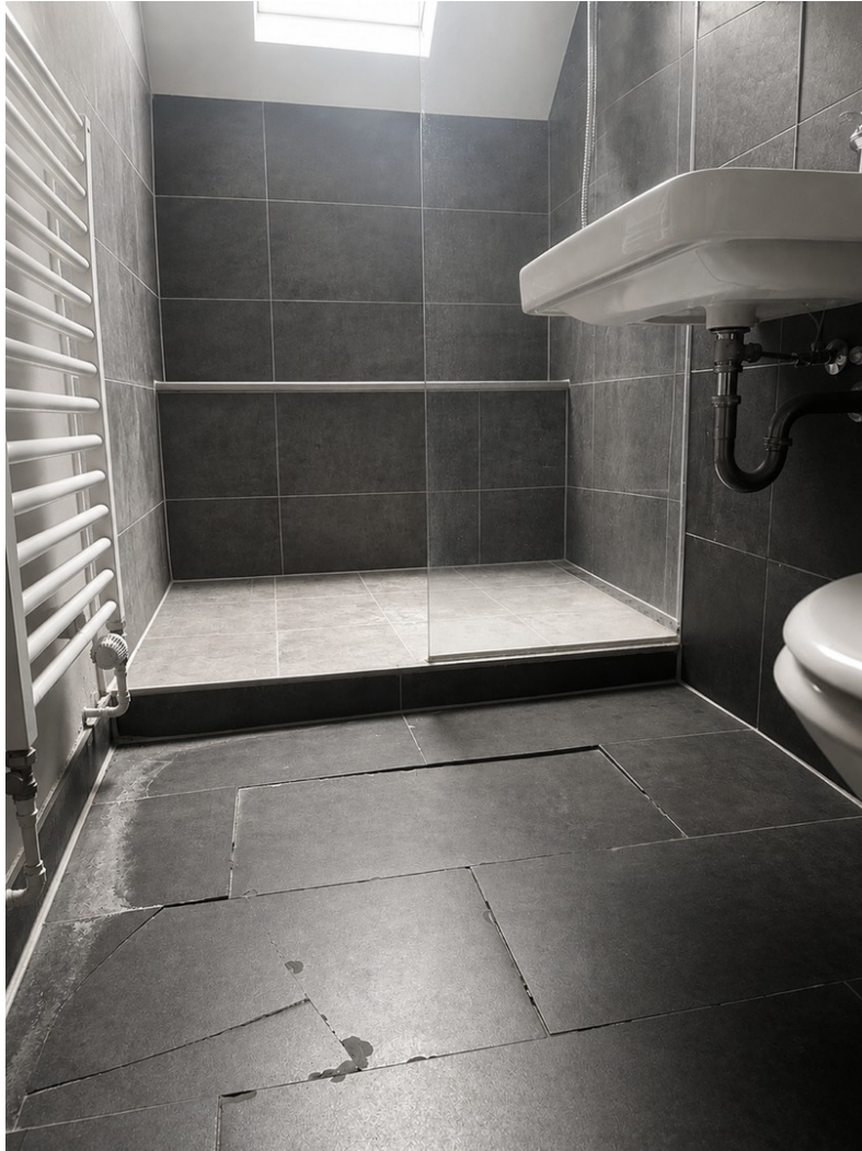
aktueller Schaden im Bad