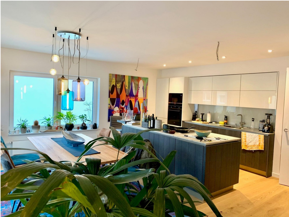
möblierter Wohn- Küchenbereich