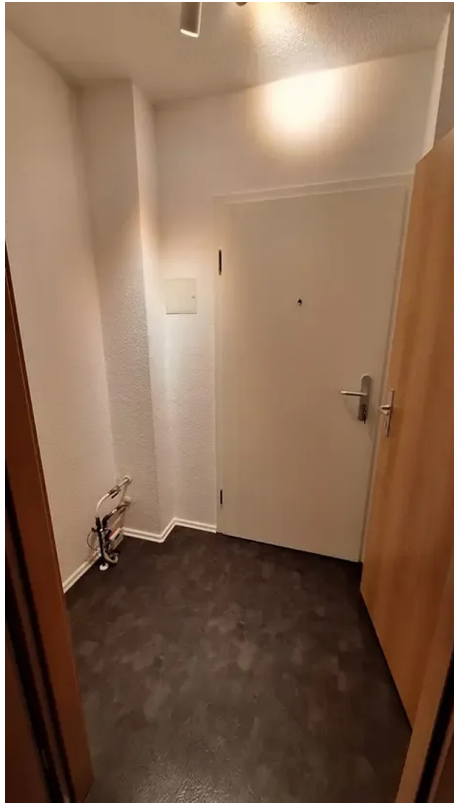
Flur und Wohnungseingang