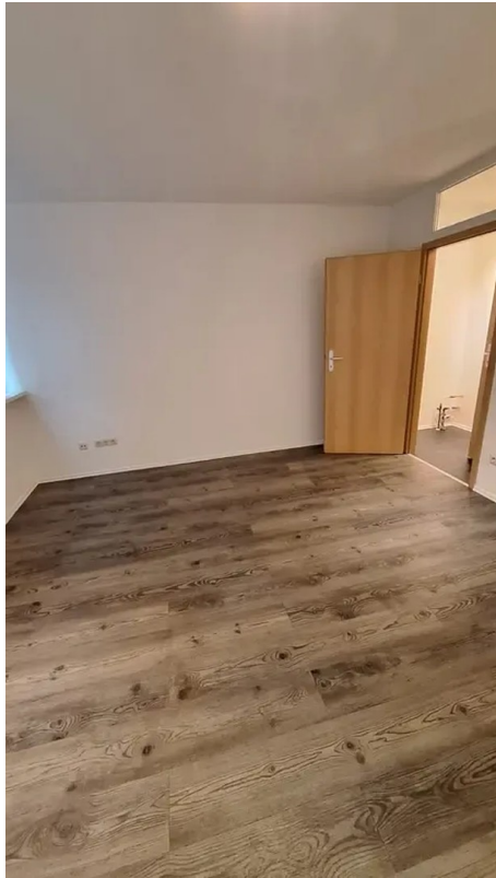
Blick Richtung Flur