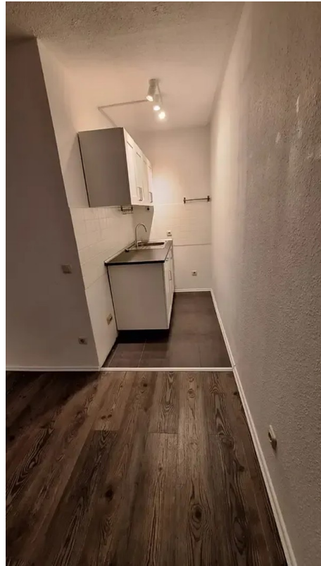
Blick Richtung Küche