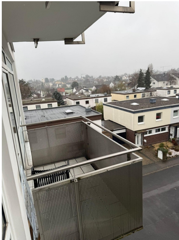
Balkon und Aussicht