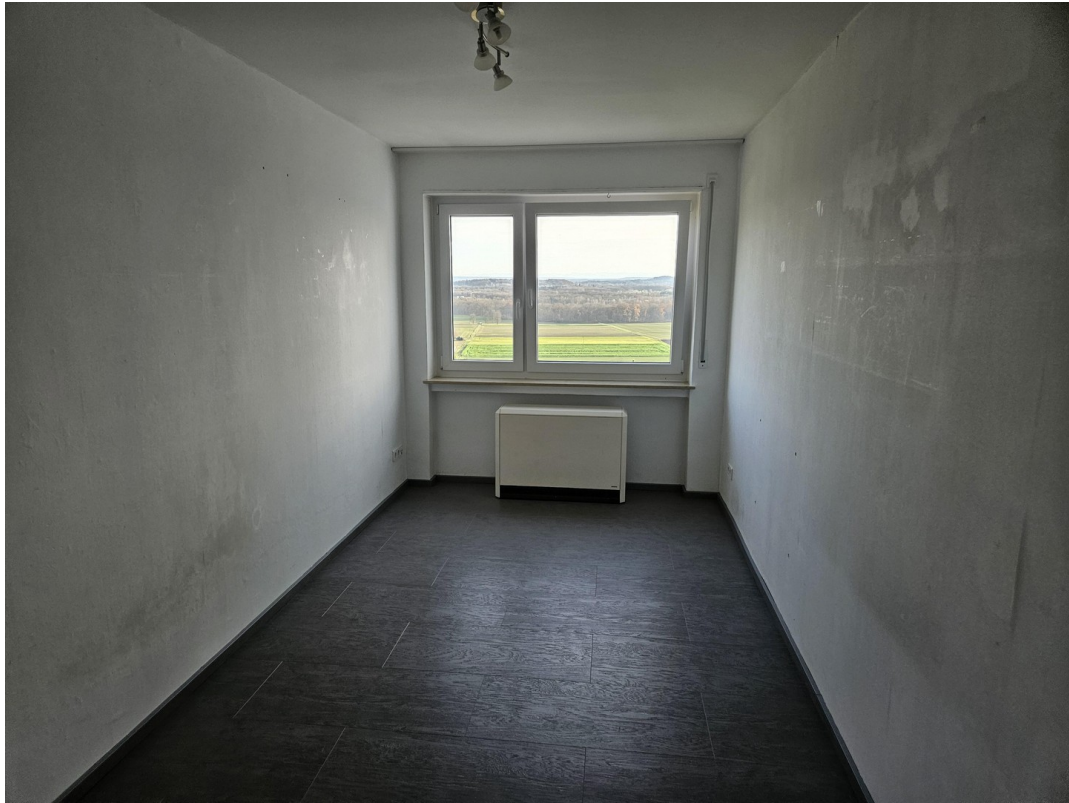
Zimmer EG Südseite