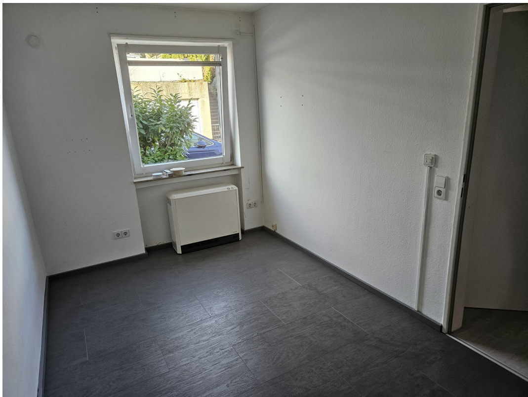
Zimmer EG Nordseite