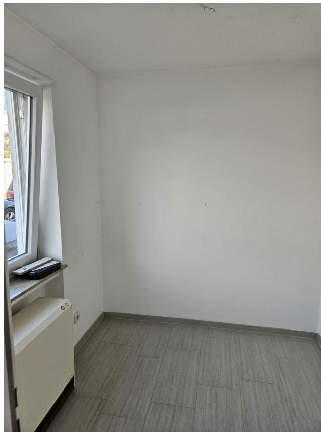
kleineres Zimmer Nordseite