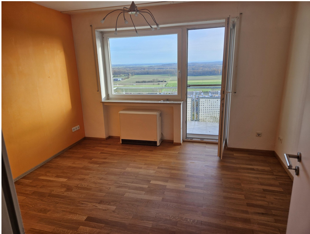
Zimmer EG Südseite mit Balkon