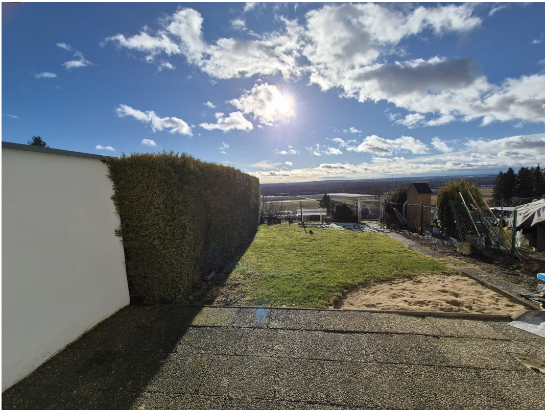
Terrasse mit Garten