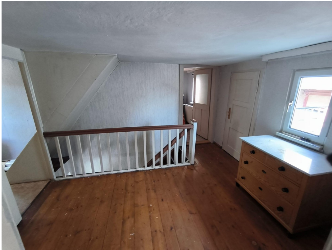
Flur 1. OG