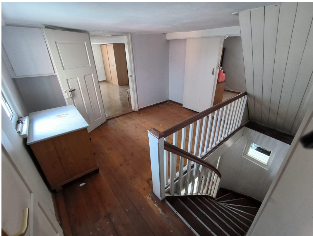
Flur 1. OG