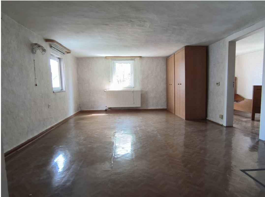
Schlafzimmer 1. OG