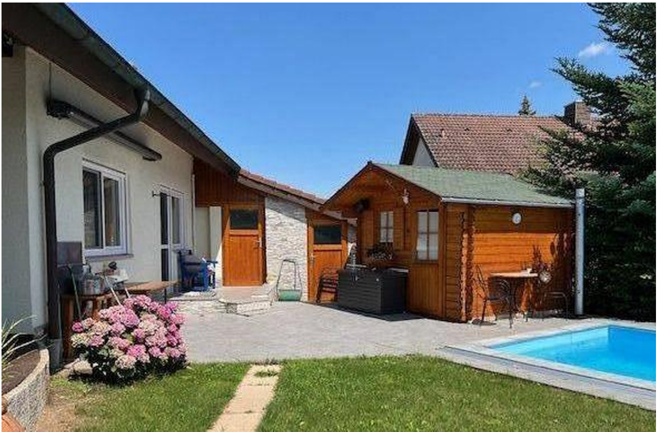
Garten Pool 6x3 m