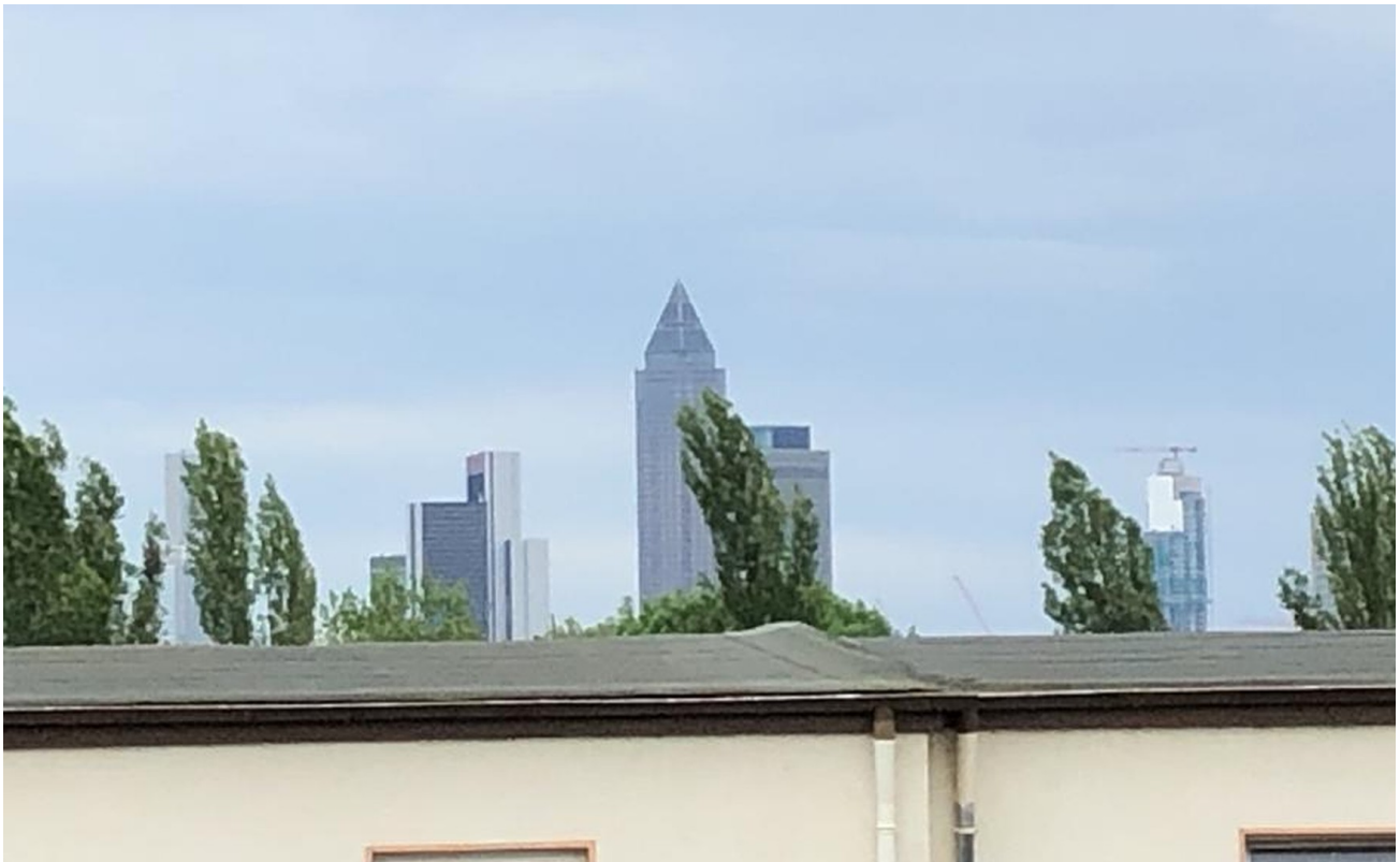
Balkon mit Sicht auf Skyline