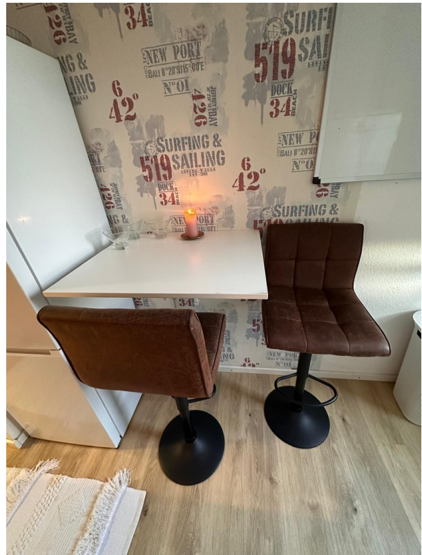
Küche mit Theke