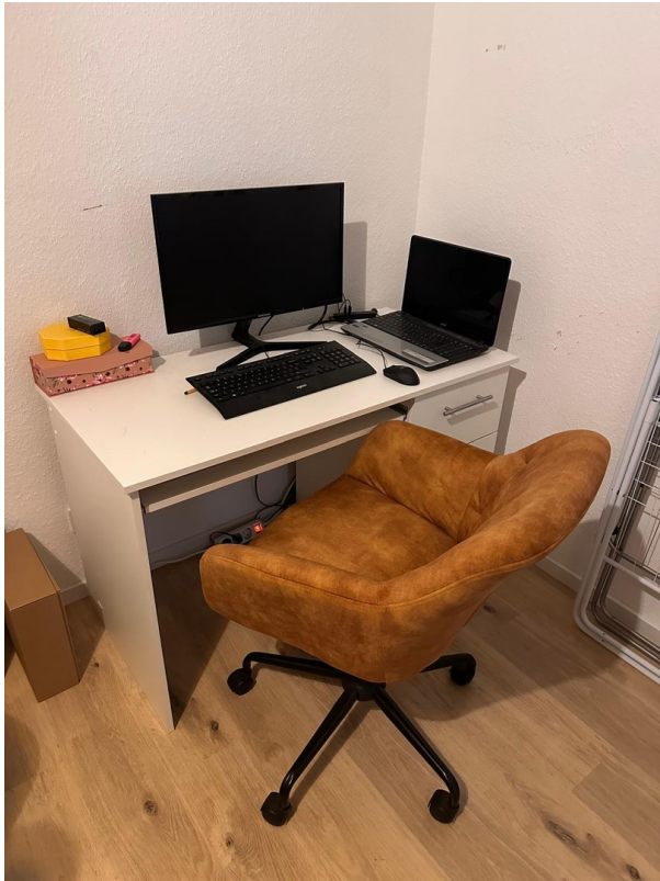
Schlaf-Zi Schreibtisch (o. PC)