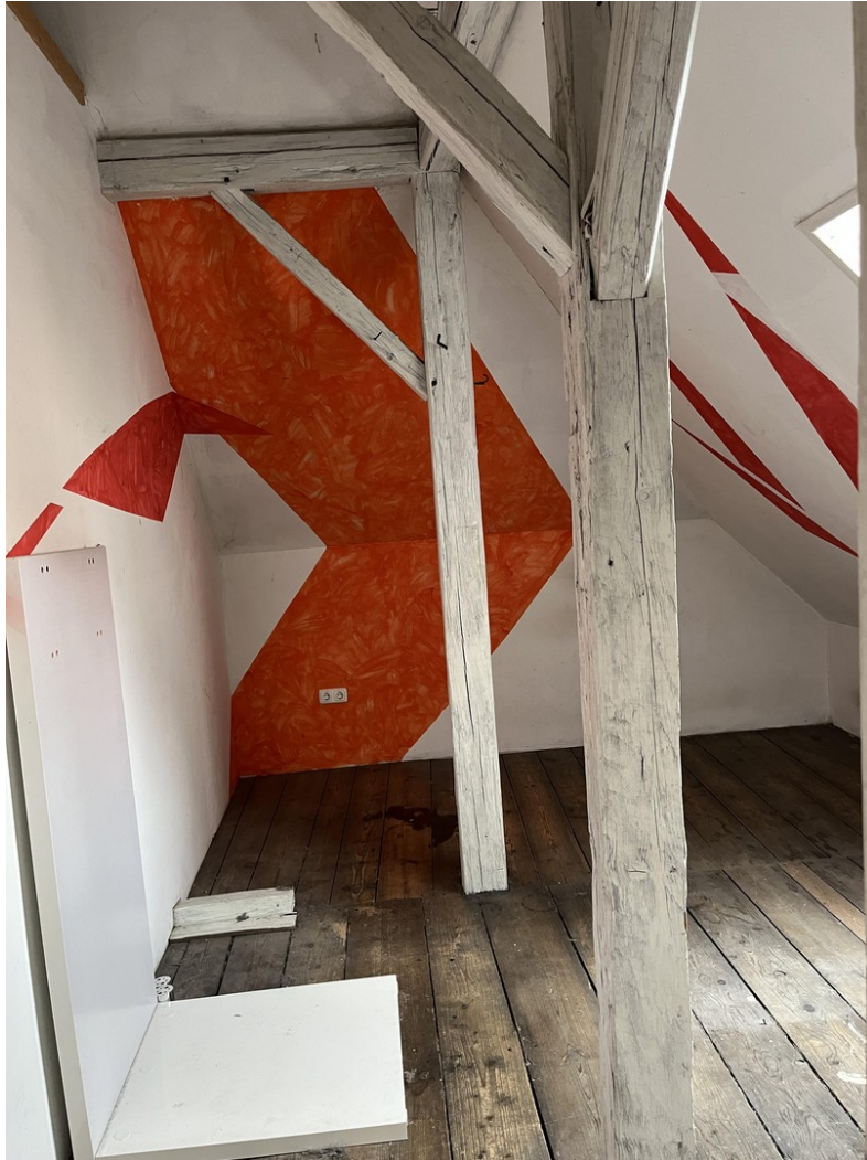
Schlafen 2 DG